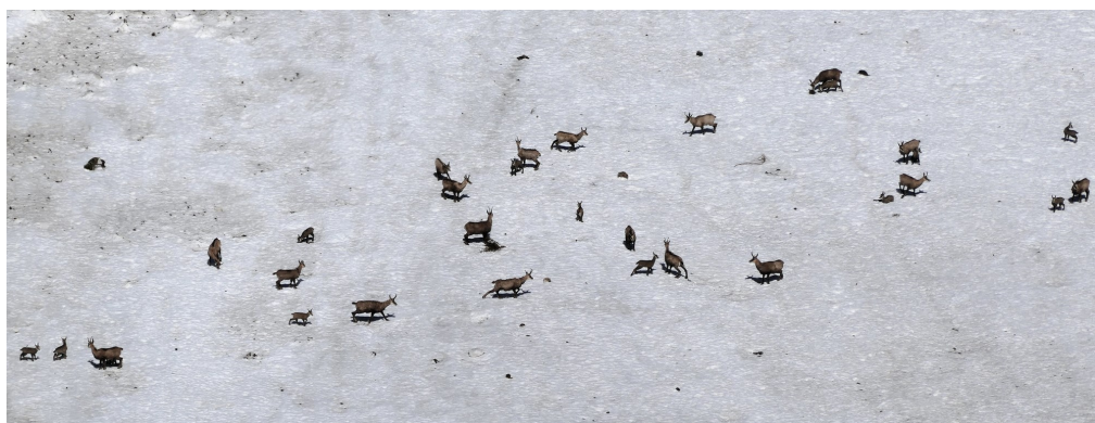
L'endroit n'est pas très couru et avec un peu de chance on peut observer des animaux sauvages (un renard à gauche et un harde de chamois à droite).

Le chemin mène rapidement à la croix sommitale du Vanil d'Arpille . Le panorama à 360° qui s'est offert à nous a été la cerise sur le gâteau qui complète cette ascension sauvage. On a un magnifique point de vue sur la chaîne des Gastlosen avec les Alpes en arrière-plan au S. À SW on