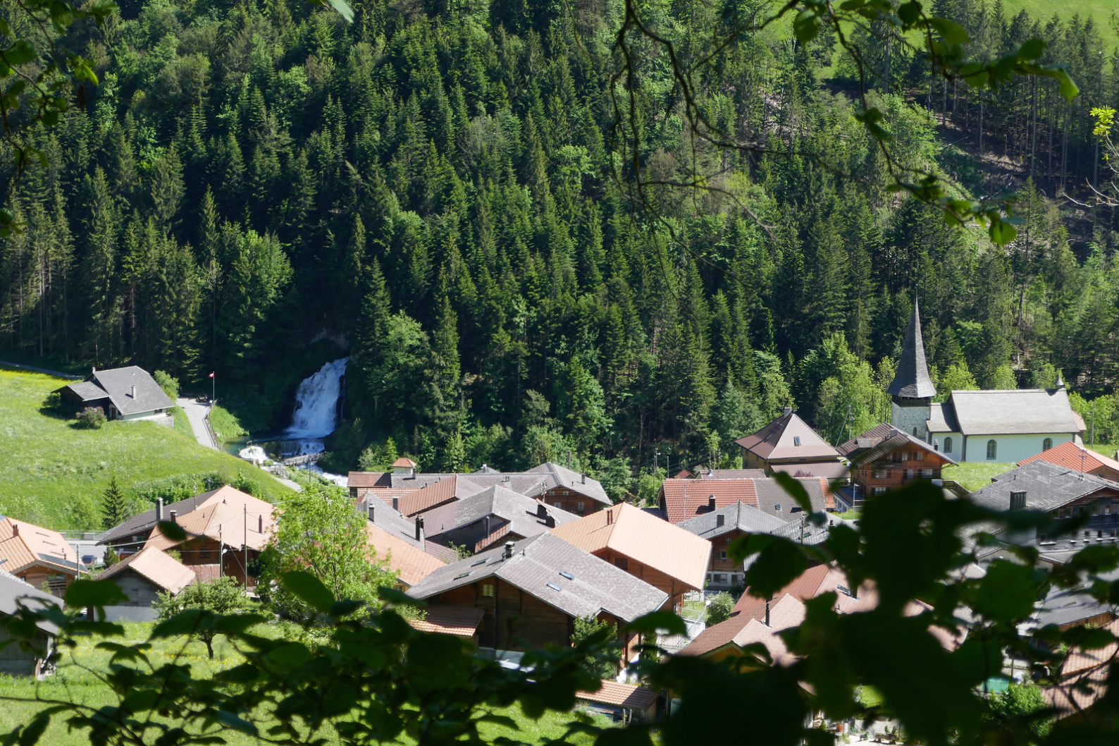
Un magnifique point de vue sur la chaîne des Gastlosen .