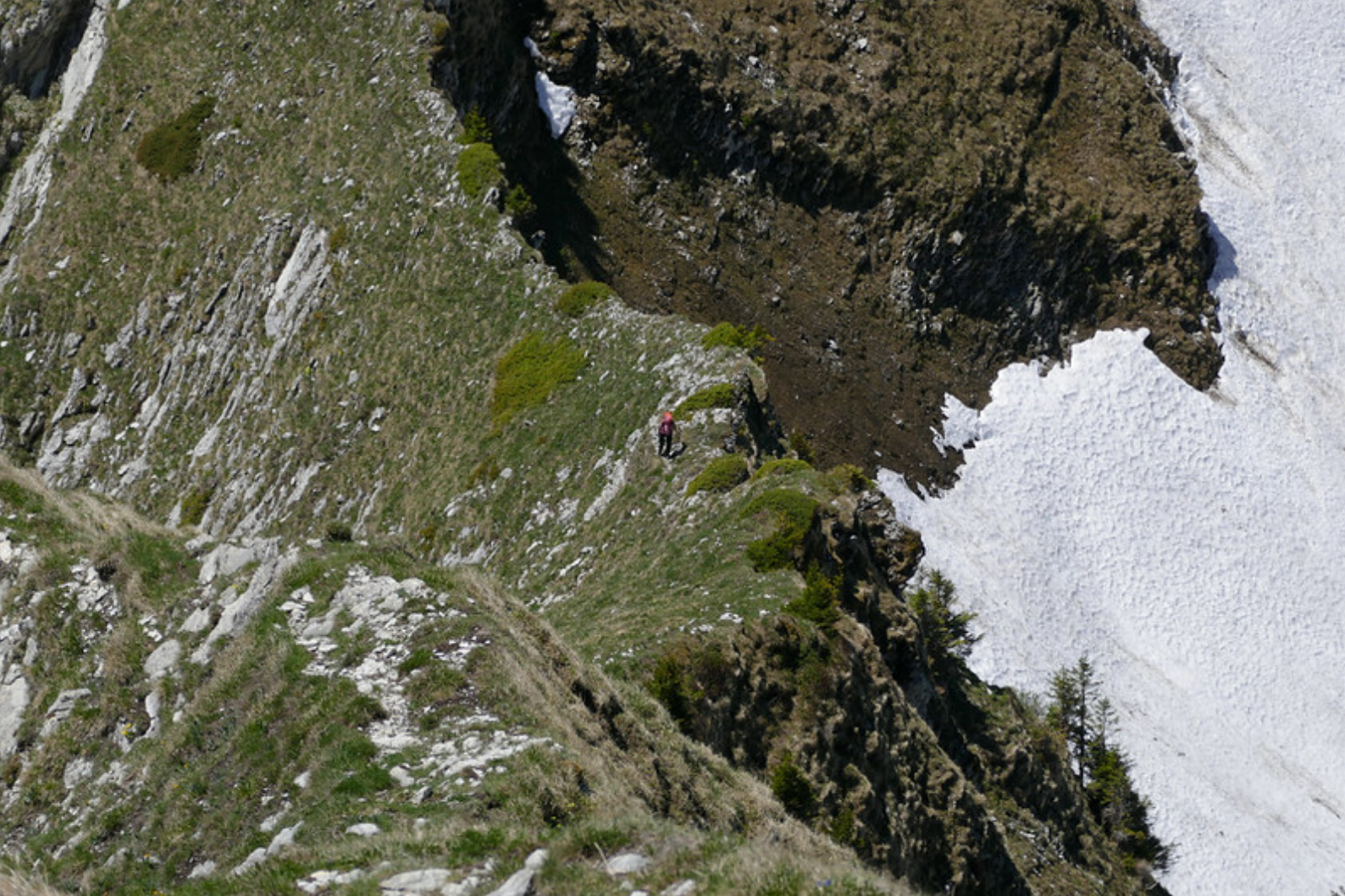
Dans la sente qui mène au sommet du Vanil d'Arpille .

d'œil dans le vallon des Fornis nous sommes passés dans l'extase : dans la combe d'Arpille , encore complètement enneigée, une harde de chamois mangeait tranquillement. Parmi la cinquantaine de bêtes il y avait aussi plusieurs petits qui jouaient entre eux.