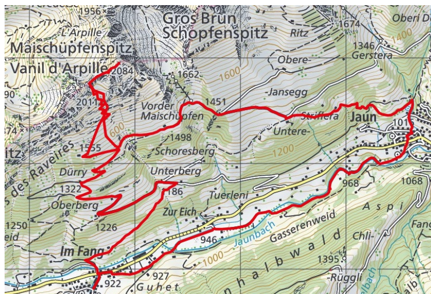
Carte nationale.

À la gare CFF de Bulle , prendre le car postal à destination de Jaun . Descendre à l'arrêt Im Fang, Praz-Jean .