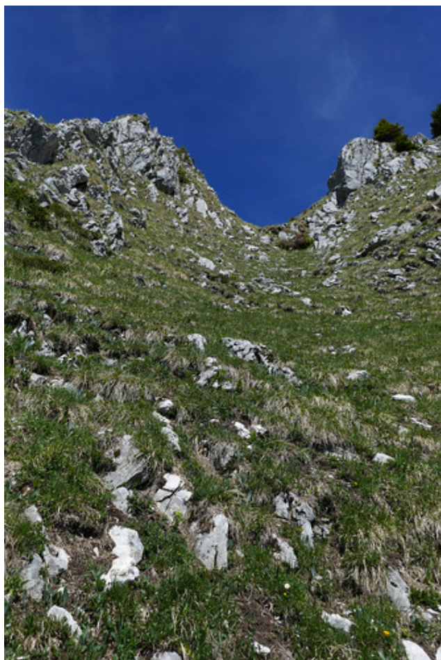
La montée pour gagner le col d'Arpille est par endroits très pentue...