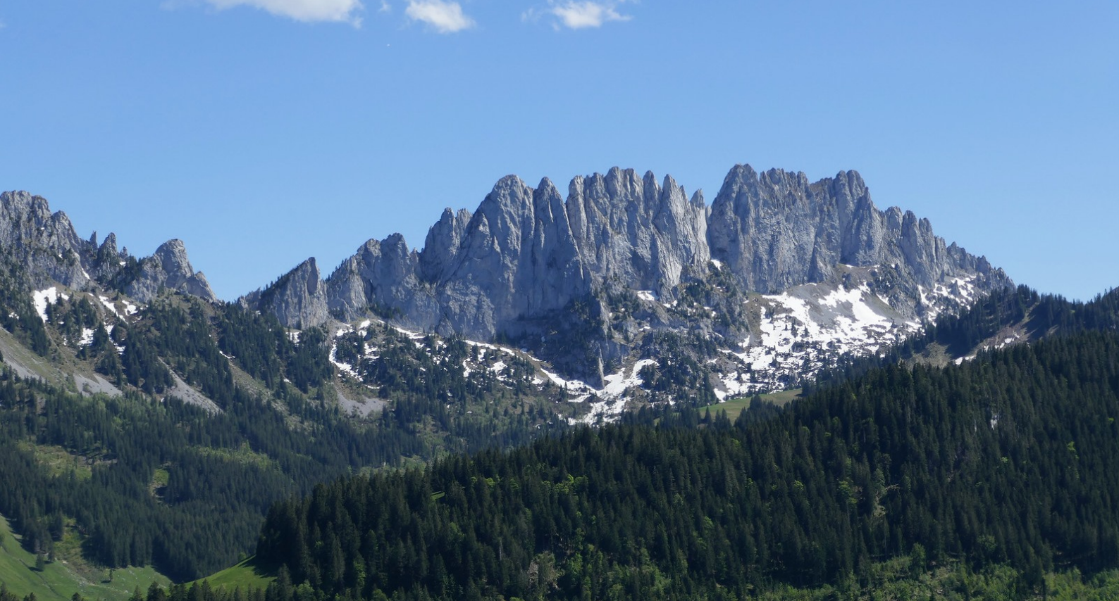
Un magnifique point de vue sur la chaîne des Gastlosen .

a le Cheval Blanc et le Hochmatt en premier plan et la Dent de Ruth et la Dent de Savigny juste derrière. À l'W on peut observer le grand frère du sommet sur lequel on se trouve : le Gros Brun .