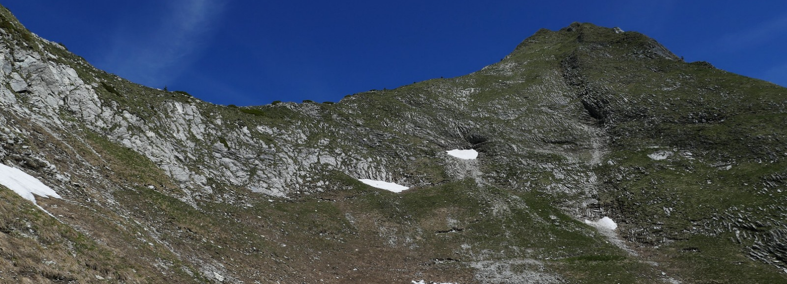
L'arête qui mène au sommet du Vanil d'Arpille .