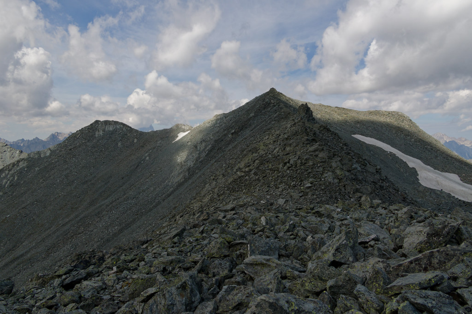
La crête qui mène au sommet de Testa Grisa. La première pointe se contourne par la gauche.