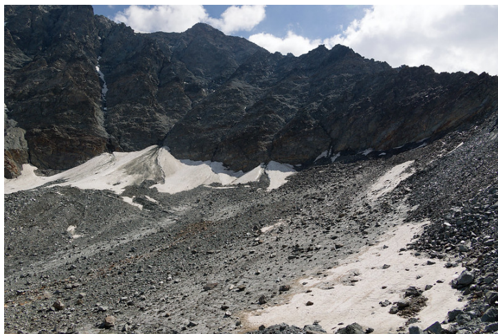
La pente qui donne accès au Col d'Annibal.

quelques excursionnistes s'y aventurent sans équipement, mais elle semble techniquement exigeante et le sol paraît friable.