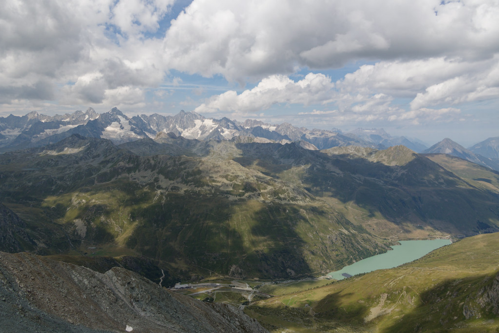
Bourg-Saint-Bernard et le lac des Toules avec le massif du Mont-Blanc en arrière plan.

Je me suis donc engagé sur l'arête rocheuse nord-nord-est de la Pointe de Moline. Jusqu'à environ 2870 mètres, le parcours est dégagé, mais au-delà, les éboulis instables prennent le relais. J'aurais pu tenter de traverser Les Fouéreuses, mais leur nom patois « fouairau, fouairausa », signifiant « foireux, qui a la diarrhée » et désigne des terrains fangeux et des cours d'eau boueux, ne m'inspirait guère confiance. J'ai donc préféré longer le flanc de la montagne, en conservant un cap nord-nord-est, jusqu'à retrouver la croix.