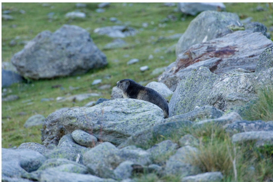
Les marmottes ont colonisé les pentes de l'ancienne piste de ski.

L'arrivée de l'ancien téléski culmine à 2270 mètres d'altitude. Elle paraissait proche, mais il a fallu son temps pour l'atteindre. L'endroit est défendu par une colline en amont en forme de U, un mur paravalanche qui protégeait autrefois la station en amont du téléski. Malgré cela, elle fut pourtant détruite par des avalanches ou des chutes de pierres.