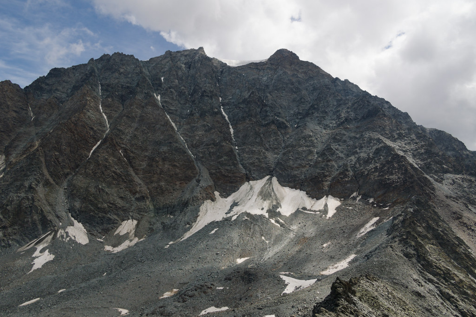
Les abruptes parois du Mont Vélan.