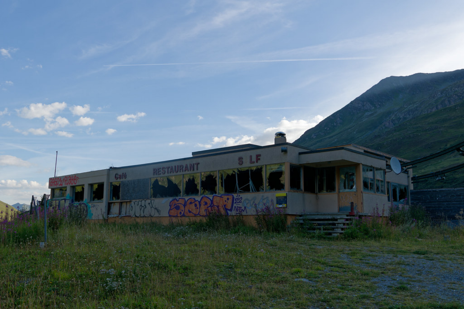
Le bâtiment délabré du restaurant de l'ancien domaine skiable du Super-Saint-Bernard.

Pour rejoindre Bourg Saint Bernard, prendre le train en direction du Châble au départ de Martigny. Descendre à Sembrancher et emprunter un deuxième train jusqu'à Orsières (terminus). Poursuivre le voyage en bus en direction du Grand-St-Bernard et descendre à l'arrêt Bourg-St-Bernard.