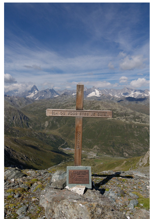
La croix érigé en mémoire de deux alpinistes décédés en 2002.

Au-dessus de 2900 m, j'ai trouvé la langue terminale du glacier qui était recouverte de caillasse. J'ai contourné un énorme bloc rocheux (marqué sur les cartes topographiques) par la droite. En face, l'Arête d'Annibal qui conduit au Mont Vélan est impressionnante. Apparemment,