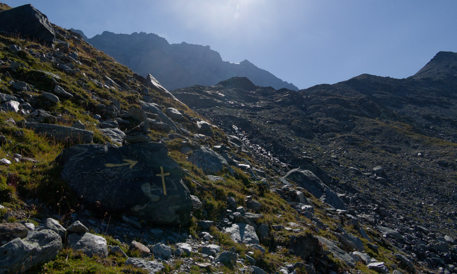
Un balisage artisanal vers 2650 mètres d'altitude.

du Grand-Saint-Bernard. Bien plus intéressant, l'on aperçoit quelques grandes cimes italiennes, françaises et suisses telles que les Grandes Jorasses et le Mont Dolent.