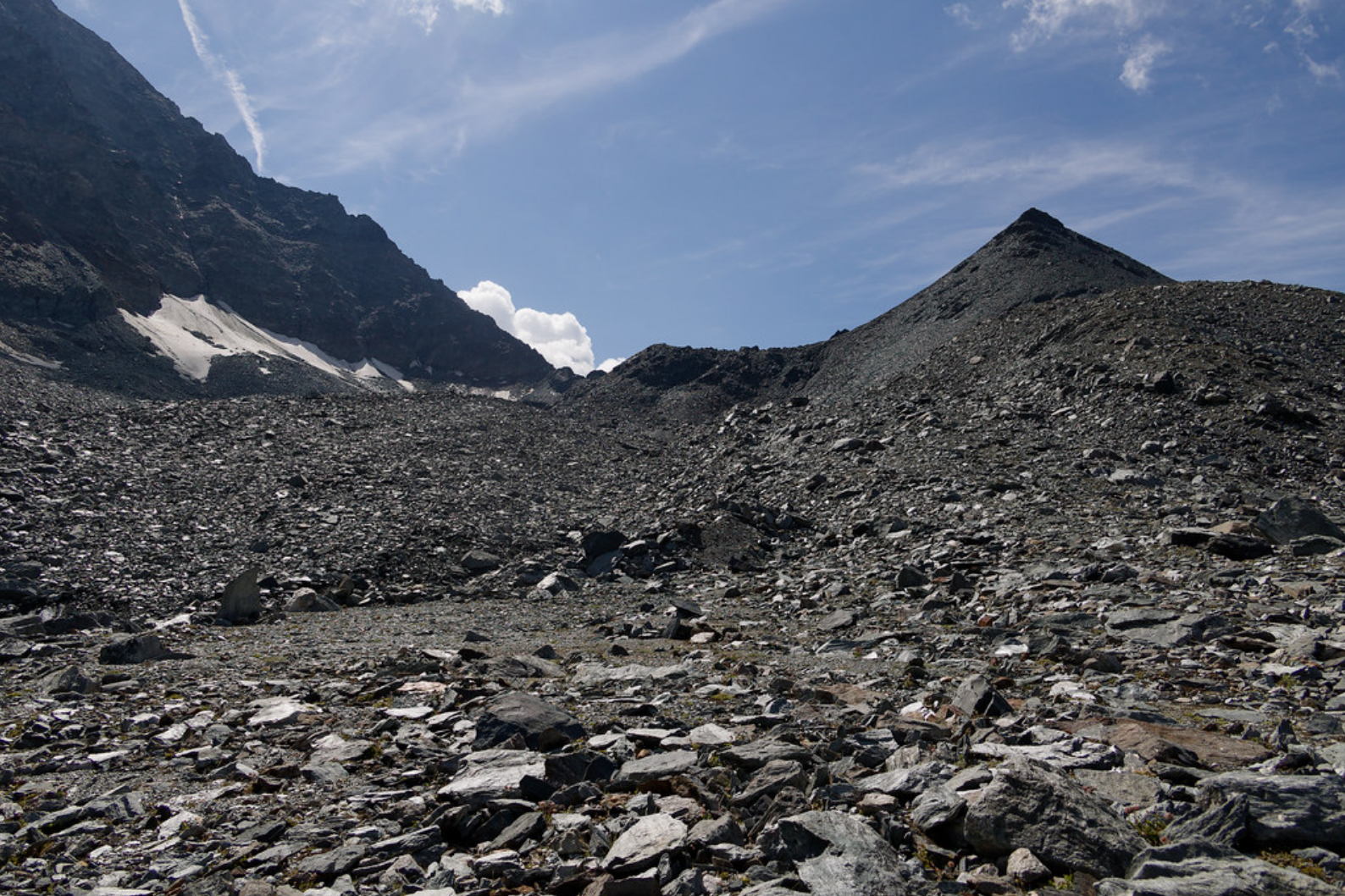
Depuis la croix, on remonte sur la plaine d'éboulis.

quelques excursionnistes s'y aventurent sans équipement, mais elle semble techniquement exigeante et le sol paraît friable.