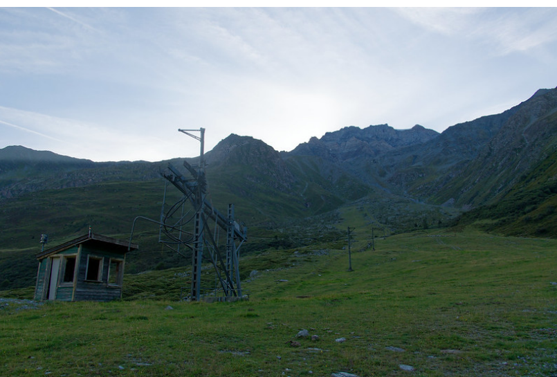
On remonte les pentes herbeuses du pâturage des Darrays.

La première chose qui frappe en arrivant sur le grand parking est le bâtiment délabré du restaurant de l'ancien domaine skiable du Super-Saint-Bernard. La petite station, construite dans les années 1960, a vieilli et le manque d'investisseurs et de viabilité ont conduit à la faillite de la société en 2010. Le site est depuis à l'abandon, et Google Maps recense d'ailleurs le vieux restaurant comme la « Ruine Super-Saint-Bernard ».