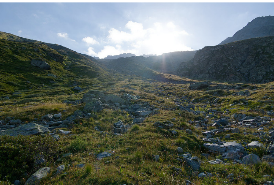
Quelques cairns indiquent la suite de l'ascension.

Sur la gauche, un semblant de sente marquée par des traces de peinture délavée et des petits cairns franchit la colline. La suite est moins évidente. Il y a quelques cairns, mais dans l'herbe, j'ai perdu la piste. J'ai mis le cap sud-est et j'ai repéré d'autres cairns par la suite. La pente se redresse sérieusement, mais la seule difficulté technique est la recherche de l'itinéraire. J'ai remonté en zigzaguant sur l'ancienne moraine latérale mi-herbeuse, mi-rocheuse.