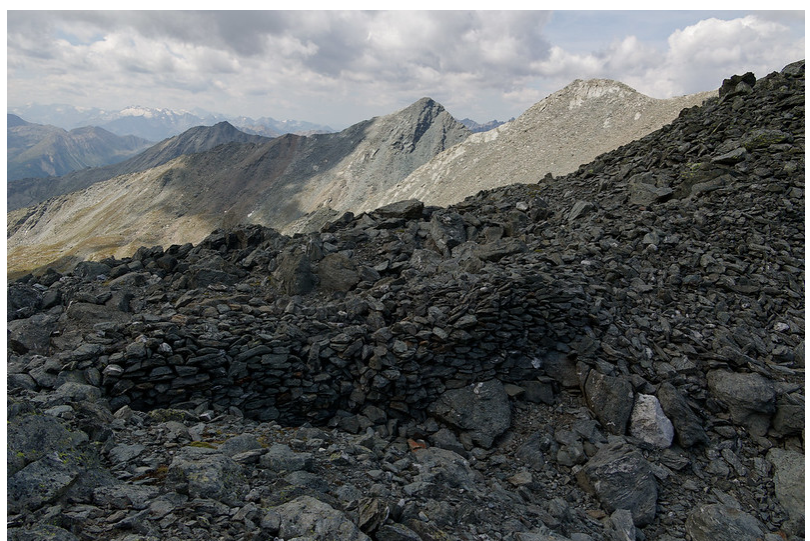
Les vestiges d'un mur de 40 mètres.