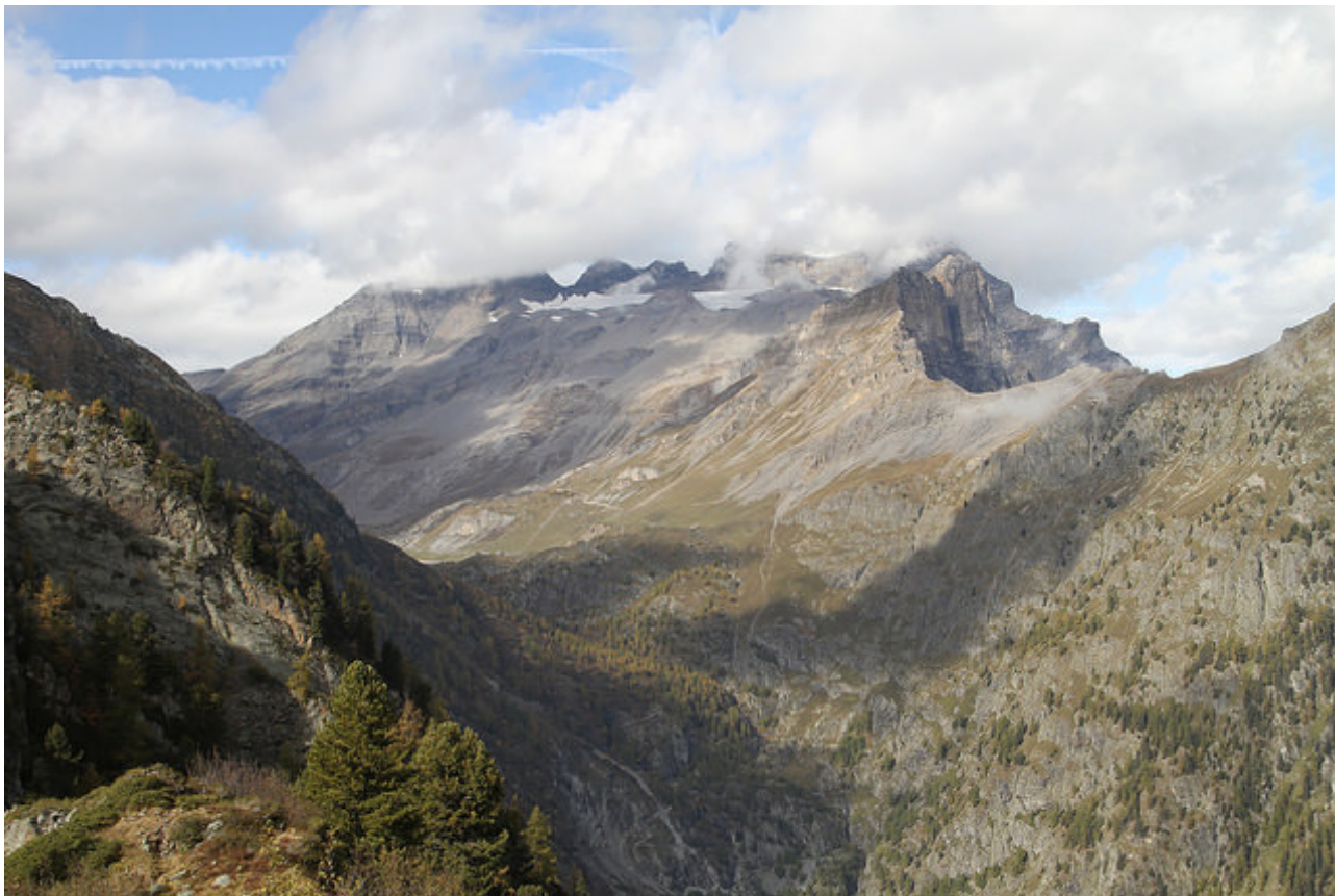
Vue sur le Dents du Midi.

Après la traversée on se retrouve en bas d'un col qu'on rejoint en remontant un court couloir par le sentier en lacets. Du col, gagner la croix sommitale du Sex des Granges qui se trouve à une petite centaines de mètres.