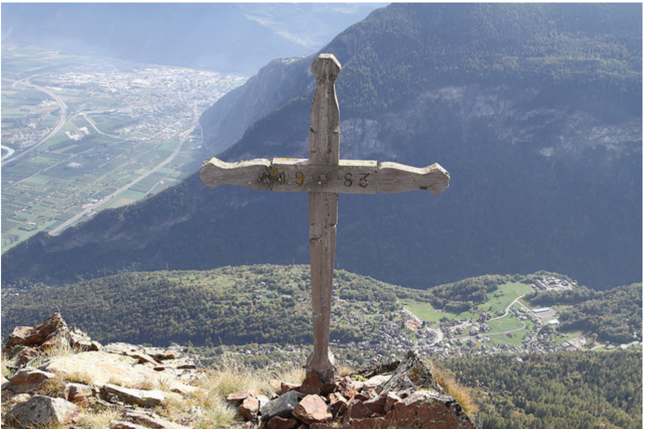
Vue depuis le sommet sur la vallée du Rhone.

Après environ 200 mètres de rude montée, la sente devient (un peu) moins raide. La progression se fait toujours en sous-bois jusqu'à 1800 mètres d'altitude environ, puis les arbres deviennent de plus en plus épars. Le sentier mène à un pierrier au contrebas d'une petite antécime à NE du sommet principale. Il faut remonter sur le pierrier avant de le traverser. La sente sur la caillasse n'est pratiquement pas visible. Il faut impérativement localiser et suivre les traces