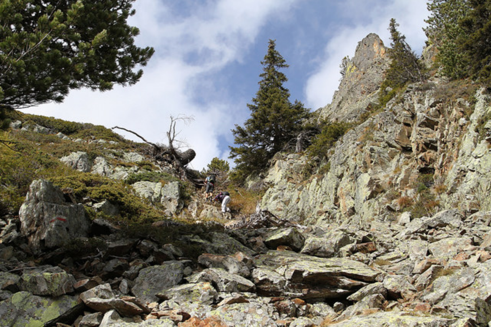
L'accès au col entre le sommet et la petite antécime (à droite).