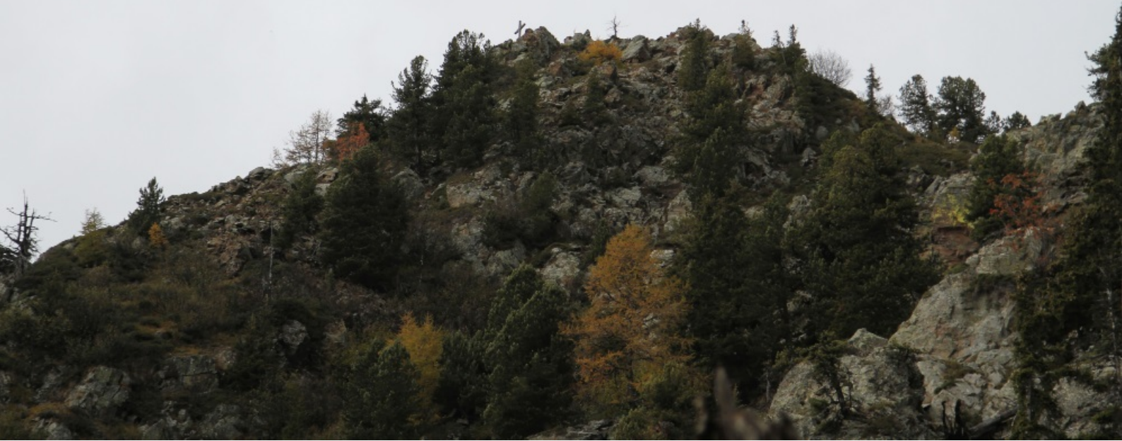
Le sommet vu depuis le pierrier.

sont superflues, mais elles sont d'une grande utilité quand le terrain est humide (et les dalles glissantes...).