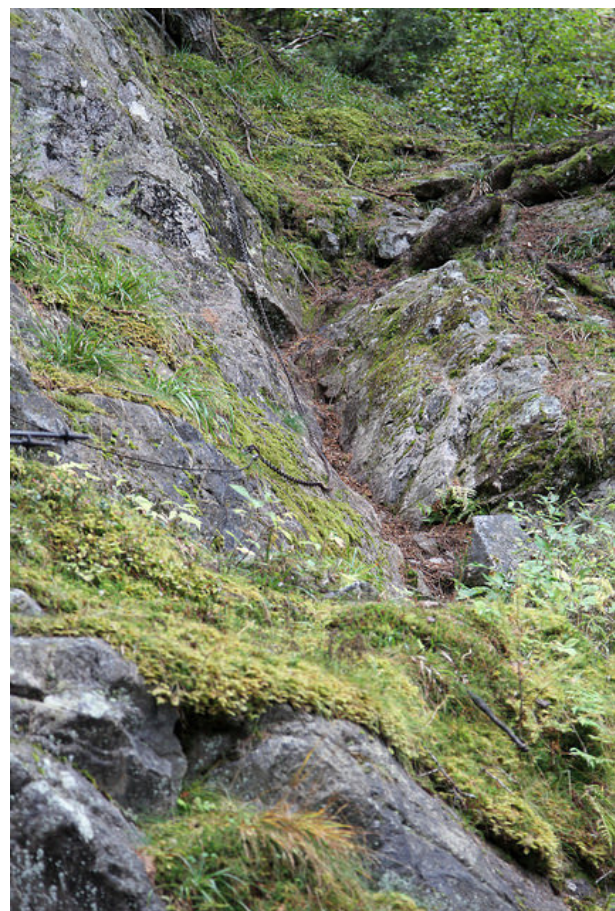
Un des passages sécurisés.

Du le Col de la Matze , suivre sur le sentier qui monte dans la forêt au Sex des Granges d'une pente très raide. Plusieurs passages ont été équipés de chaînes. Par temps sec elles