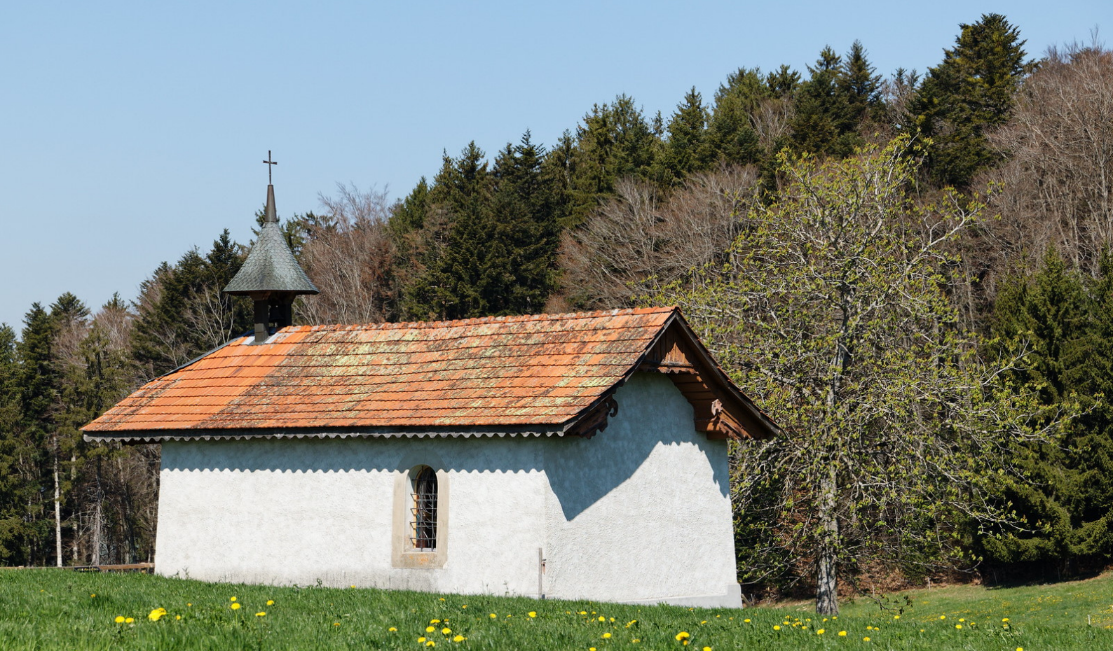
La chapelle de St-Joseph.

asphaltée sur la droite. C'est le départ de « La cotze dou héron » ou, pour les personnes qui ne parlent pas le patois du coin (dont je fais partie...), « Le sentier du héron ».