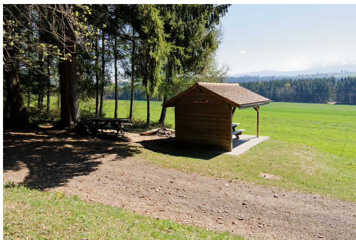
Le Chindé , un couvert avec deux tables et un endroit pour allumer du feu.

Du parking le long de Route des Chapelettes , un large chemin herbeux part en direction nord-est et pénètre dans la forêt. Il ne faut pas marcher longtemps avant de croiser une maisonnette. À l'intérieur, une feuille plastifiée donne quelques informations sur une des planètes du système solaire. Une dizaine de ces minuscules constructions en bois sont disséminées tout au long du Sentier des Fées . J'avais planifié la balade de sorte à parcourir ce sentier en tout dernier. Du coup, c'était une des dernières maisonnettes par rapport à l'ordre chronologique que nous avons croisé en premier. Cela ne gâche en rien la promenade : le contenu de chaque station est indépendant.