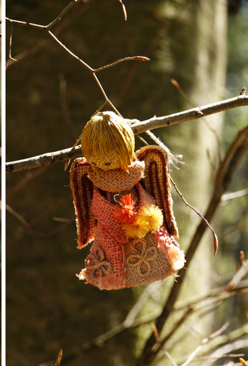
Des rencontres féeriques...

150 mètres plus loin, prendre le branchement de droite. On gagne rapidement une petite place avec une table en bois installée à côté d'un petit ruisseau.