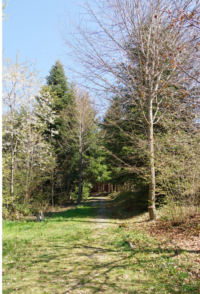
Très vite on pénètre dans une jolie forêt.

Bien qu'il y ait peu de voitures, marcher sur de l'asphalte, ce n'est pas le plus intéressant. Il n'y a plus que 400 mètres à tenir. Juste après avoir passé une maison, un chemin quitte la route