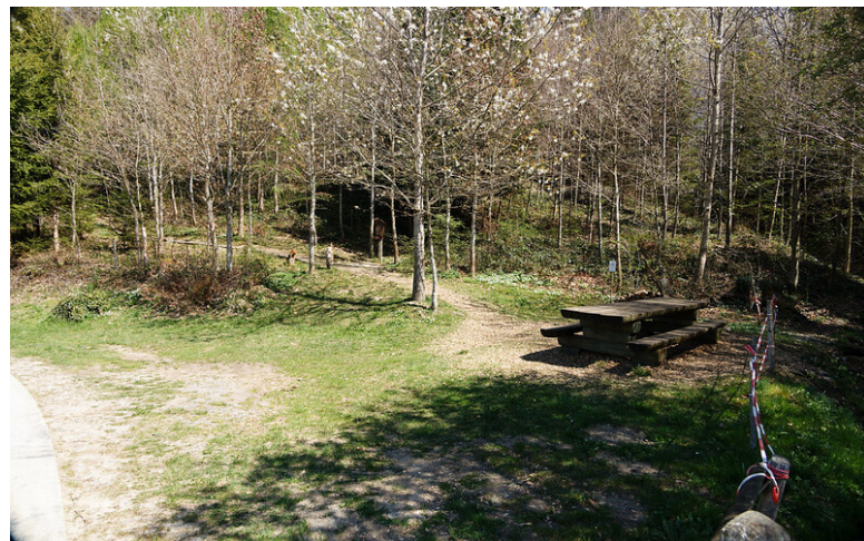
La partie intéressante du sentier des fées débute à côté d'une table en bois et un ruisseau.

Une courte montée mène au lieu-dit de La Possession . Là, on quitte définitivement les Bois d'Illens . Suivre un vague sente en direction ouest jusqu'à rejoindre les habitations.