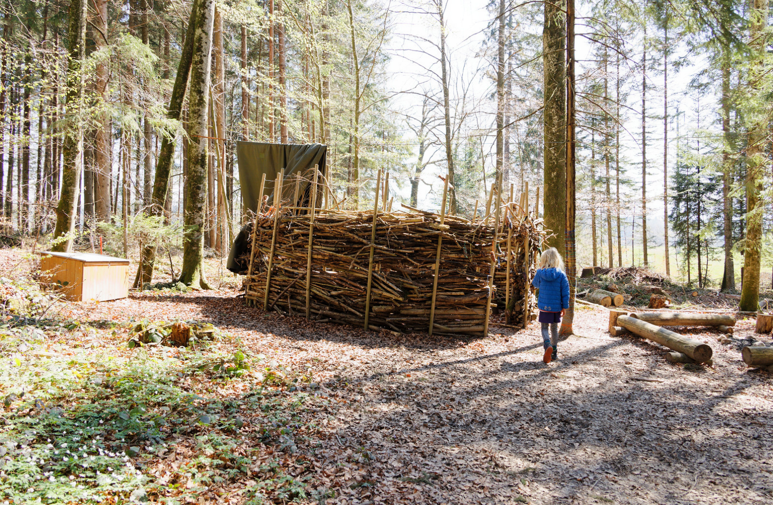
La canapé forestier dans les Bois d'Illens.

des multiples arrêts obligatoires pour pouvoir lire les panneaux, il nous a fallu beaucoup de temps pour rejoindre la place de pique-nique avec des tables, un foyer et quelques jeux. Bien évidemment, mon fils a voulu s'arrêter un moment pour jouer.