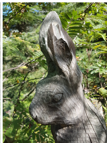
Le long du sentier on croise plusieurs animaux en bois sculptés à la tronçonneuse.