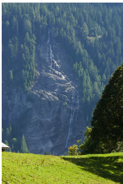
La cascade de Tungal.

Le long du chemin on trouve toute une série d'animaux locaux en bois. Ils ont été sculptés à la tronçonneuse par des sylviculteurs et des gardes-forestiers. Le résultat est vraiment remarquable et toutes les sculptures sont parfaitement intégrées dans la nature. Du coup on gravit les quelques 130 mètres de dénivelé pour arriver à proximité du Lauenensee sans que s'en rende compte.