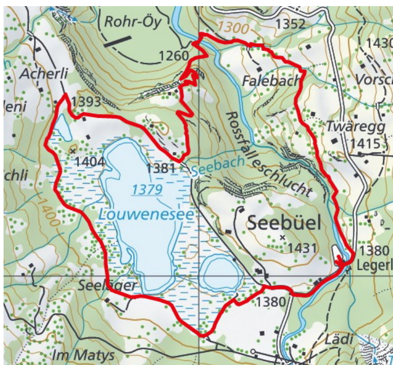
Carte nationale.

Au départ de Gstaad il y a régulièrement des bus pour Lauenensee .