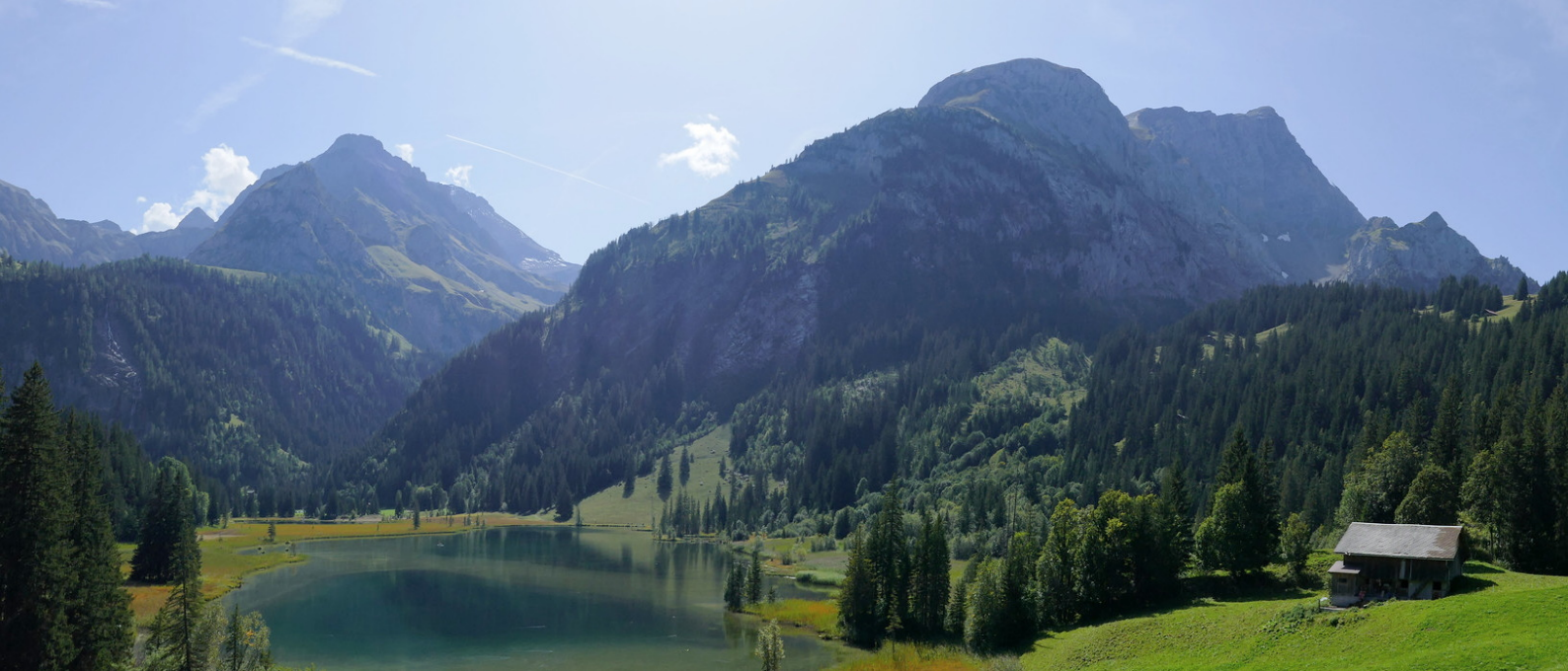
Le lac de Lauenen avec le Spitzhorn (à droite) et le Arpelistock (à gauche).