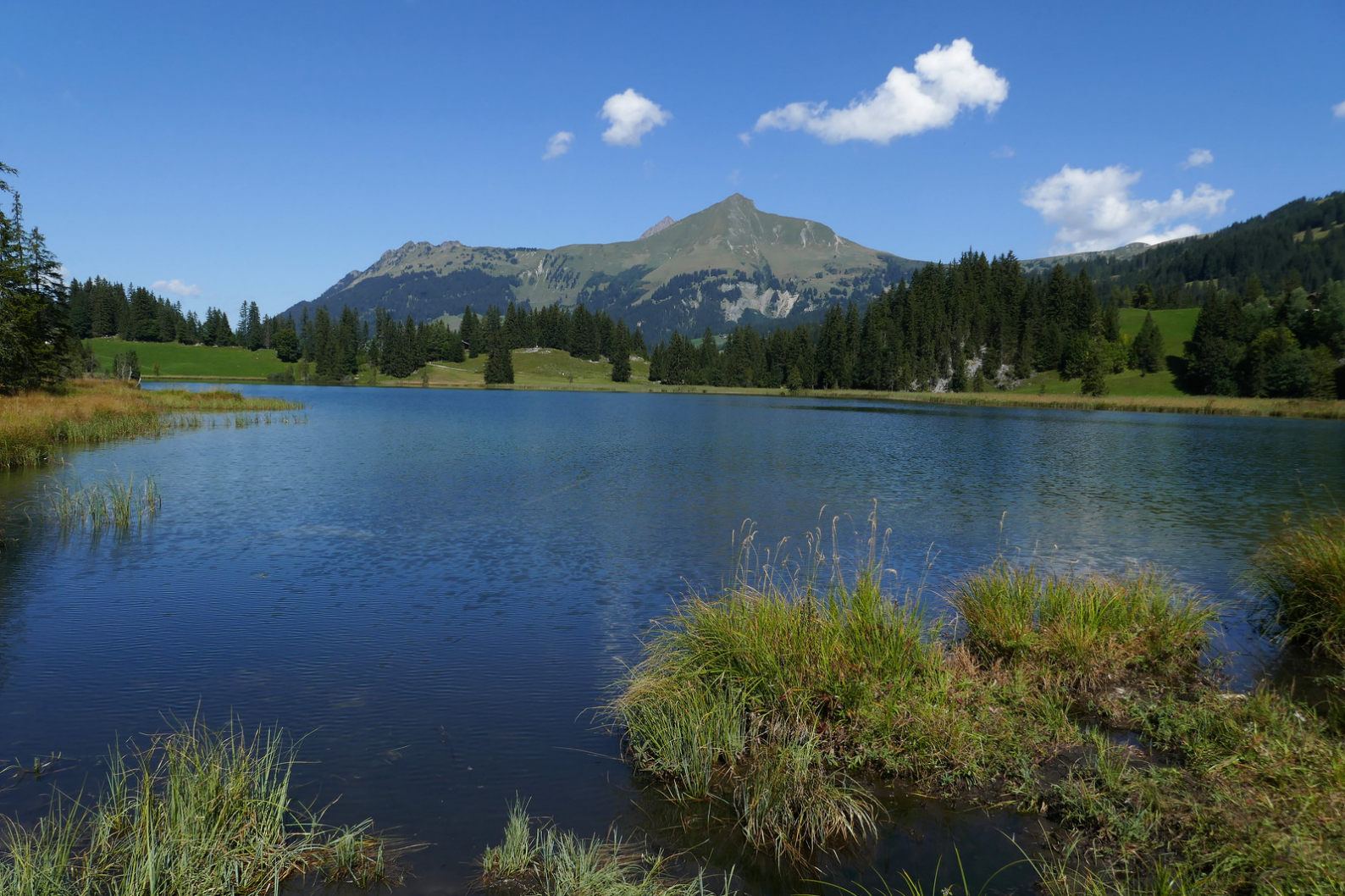
Sur l'autre rive du lac de Lauenen.

rossable. Partir ensuite à droite en direction de Hinderem See . Il y avait pas mal de randonneur et de cyclistes sur la route, mais ça restait tout de même très agréable.