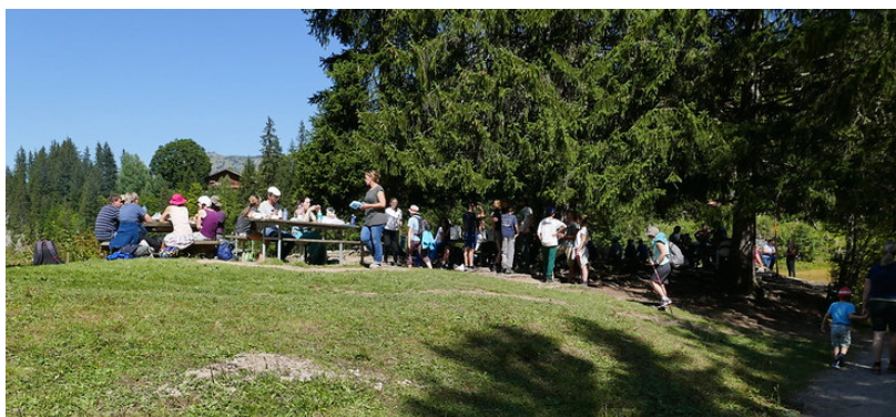
L'aire de pique nique avec des tables en bois.

On passe ensuite à proximité du Petit Lac de Lauenen (Kleiner Lauenensee) où on découvre une aire de pique nique avec des tables en bois. Sans surprise l'endroit était pris d'assaut. Juste à côté il y a aussi une petite plateforme en bois pour les nageurs.