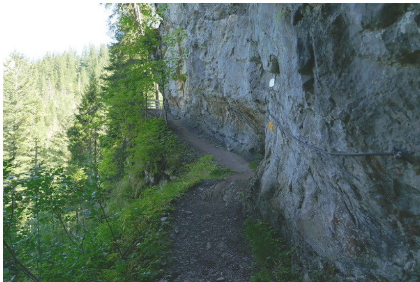
Le deuxième passage sécurisé.

Une courte montée mène à une bifurcation où trône une jolie sculpture en bois. Le sentier monte ensuite en forêt en direction du lac de Lauenen ( Lauenensee sur les panneaux). Quelques centaines de mètres plus loin, après une série de marches, on se retrouve face à deux magnifiques castors... en bois. Juste après les sculptures des castors il faut franchir un nouveau passage aérien sécurisé, comme auparavant, par des câbles.