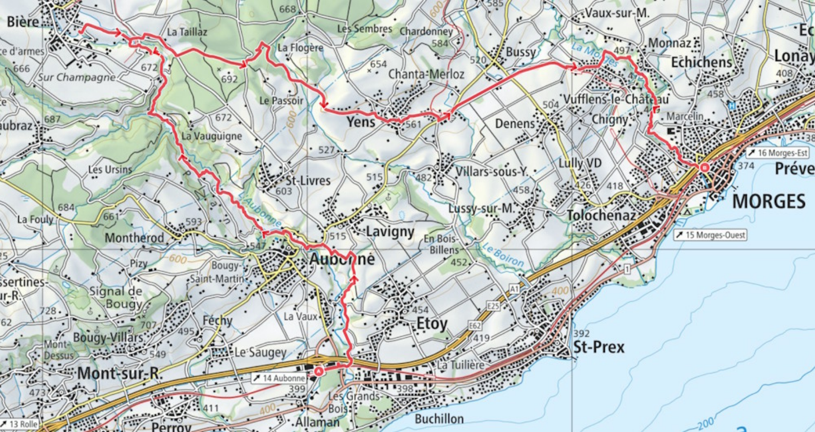
Carte nationale.