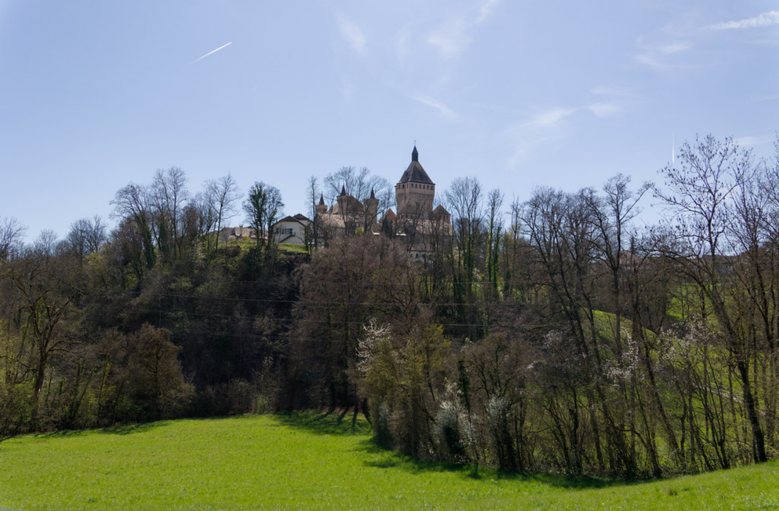
Le château de Vufflens-le-Château.

Piqué par la curiosité, j'ai d'abord voulu constater de mes propres yeux l'ampleur de cet « important glissement de terrain », avant même de réfléchir à un éventuel détour. Je n'ai pas eu à marcher longtemps : le spectacle qui s'offrait à moi était pour le moins surprenant. Au lieu-dit de La Combaz, une passerelle en bois ressemblait désormais à une véritable rampe de lancement, inclinée de manière absurde vers le ciel. Si le glissement de terrain en lui-même n'était finalement pas aussi impressionnant que le laissait craindre la signalétique, les dégâts causés par les intempéries étaient, eux, bien réels.