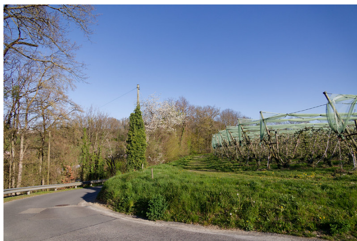
Emprunter la piste entre la bande de forêt et les vergers.

Toutefois, il existe une hypothèse plus nuancée : selon un article publié dans la revue « Passé