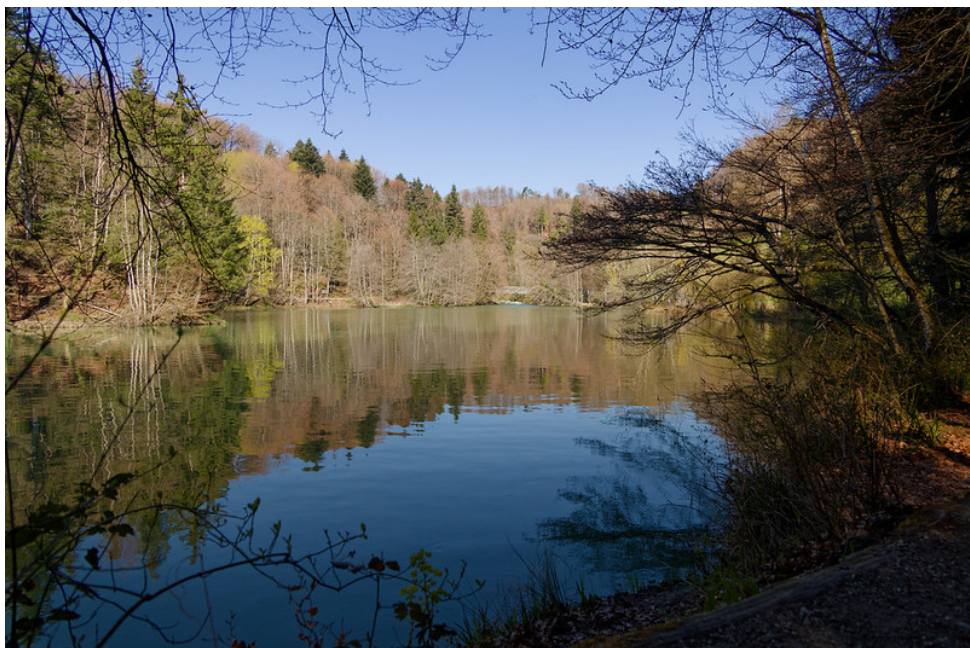
Lac artificiel formé par le barrage de la centrale hydroélectrique du Plan Dessous.

Le long de la route, plusieurs panneaux incitaient les visiteurs à s'acquitter volontairement du droit d'entrée pour la visite du parc. J'avoue ne pas l'avoir payé. Pour autant, je n'ai pas eu l'impression d'enfreindre la moindre règle, car je me suis strictement contenté de traverser l'Arboretum sans réellement le visiter, en suivant le balisage. Or, les chemins de randonnée pédestre bénéficient en Suisse d'une protection juridique claire et, pour autant qu'aucune fermeture temporaire ne soit signalée, ils peuvent être empruntés librement et gratuitement.