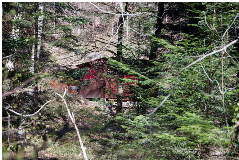
Le chalet des source.

Face à ces constats, j'ai finalement choisi de ne pas faire ce détour, préférant économiser du temps (et sans doute m'épargner une certaine déception), pour me concentrer sur la suite de mon périple.