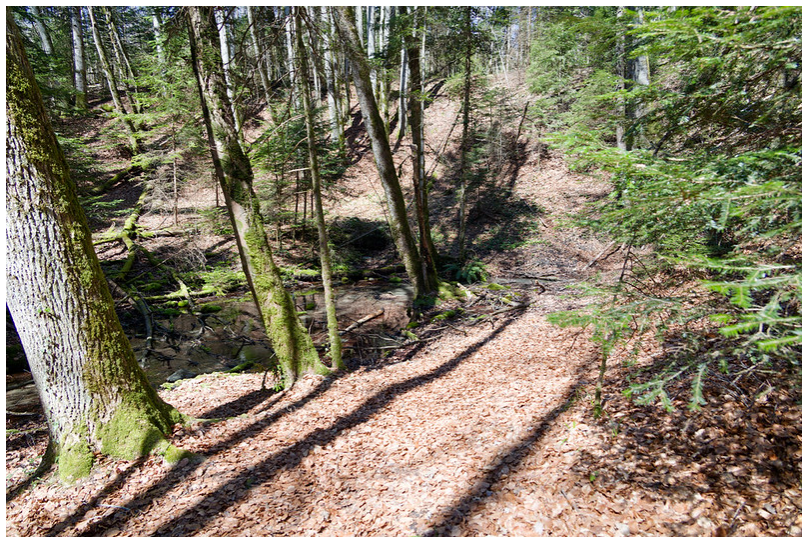
Une émergence du Boiron.

La gare du train BAM se trouvait à moins de dix minutes à pied du banc où je m'étais arrêté, ce qui m'offrait la possibilité d'interrompre ma randonnée à cet endroit, mais il n'était que midi et mes jambes ne montraient aucun signe de fatigue ; au contraire, elles semblaient encore pleines d'énergie. J'ai donc résolument choisi de poursuivre l'aventure en direction de mon prochain objectif : la source du Boiron, en l'occurrence celui de Morges, et non son homonyme qui coule du côté de Nyon.