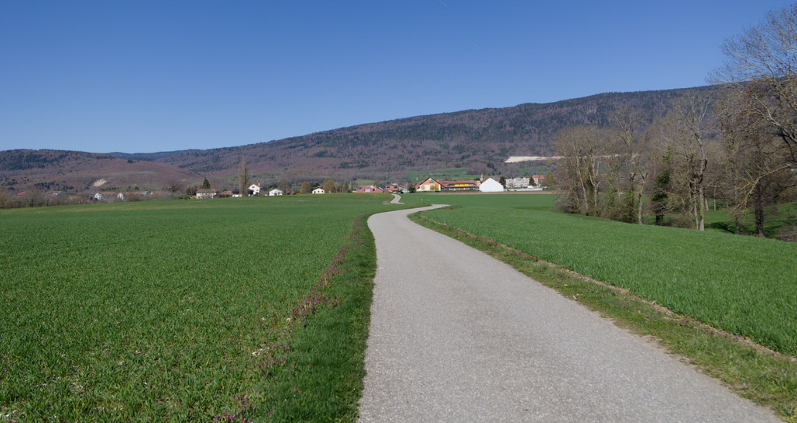
Le village de Bière.

« terrain nu ou peu cultivé », et désignerait simplement une plaine. Certains spécialistes attribuent plutôt cette origine à l'ancien français « berrie » ou au celtique « *beria » ou « *bira », dont la signification reste similaire. Étant donné la configuration très plate du territoire, cette explication apparaît particulièrement cohérente.