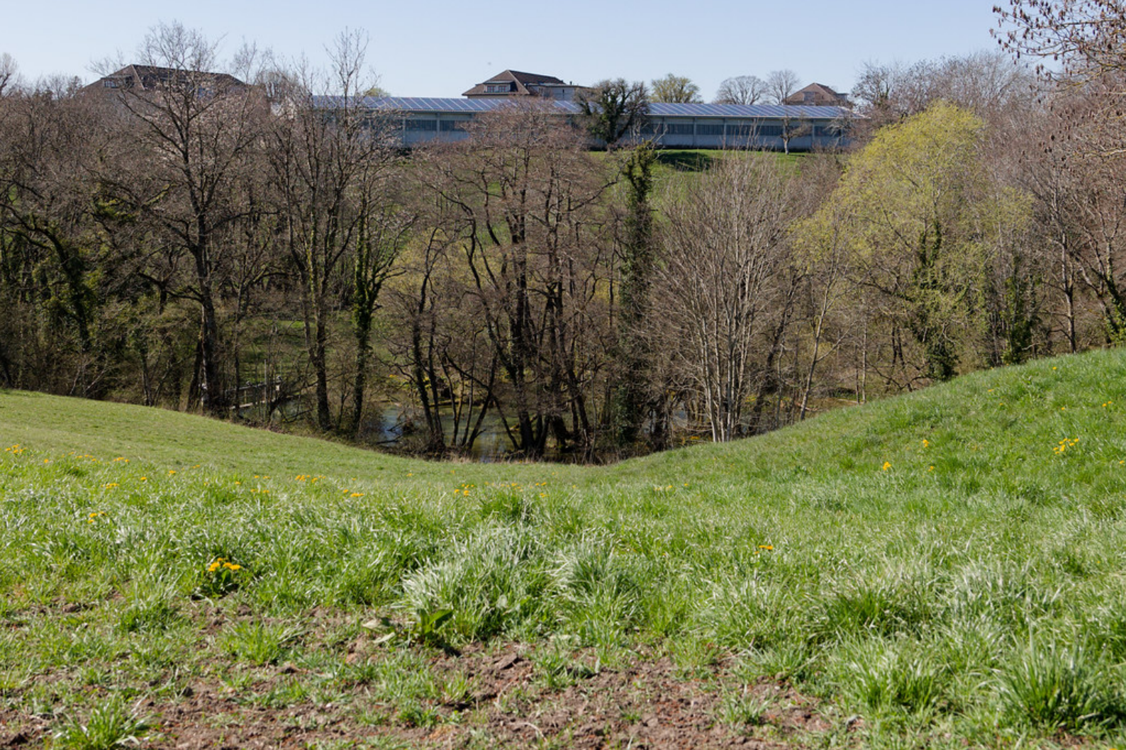
Les sources de l'Aubonne.

Comme mentionné précédemment, les eaux de l'Aubonne proviennent d'un vaste réseau hydrogéologique de type karstique situé dans le massif jurassien. Le fonctionnement de ce système est complexe : certaines sources demeurent actives en permanence, tandis que d'autres ne se manifestent qu'après de fortes pluies ou lors de la fonte des neiges, ne coulant alors qu'occasionnellement. Ainsi, l'Aubonne et le Toleure prennent tous deux naissance dans ce même ensemble aquifère souterrain.