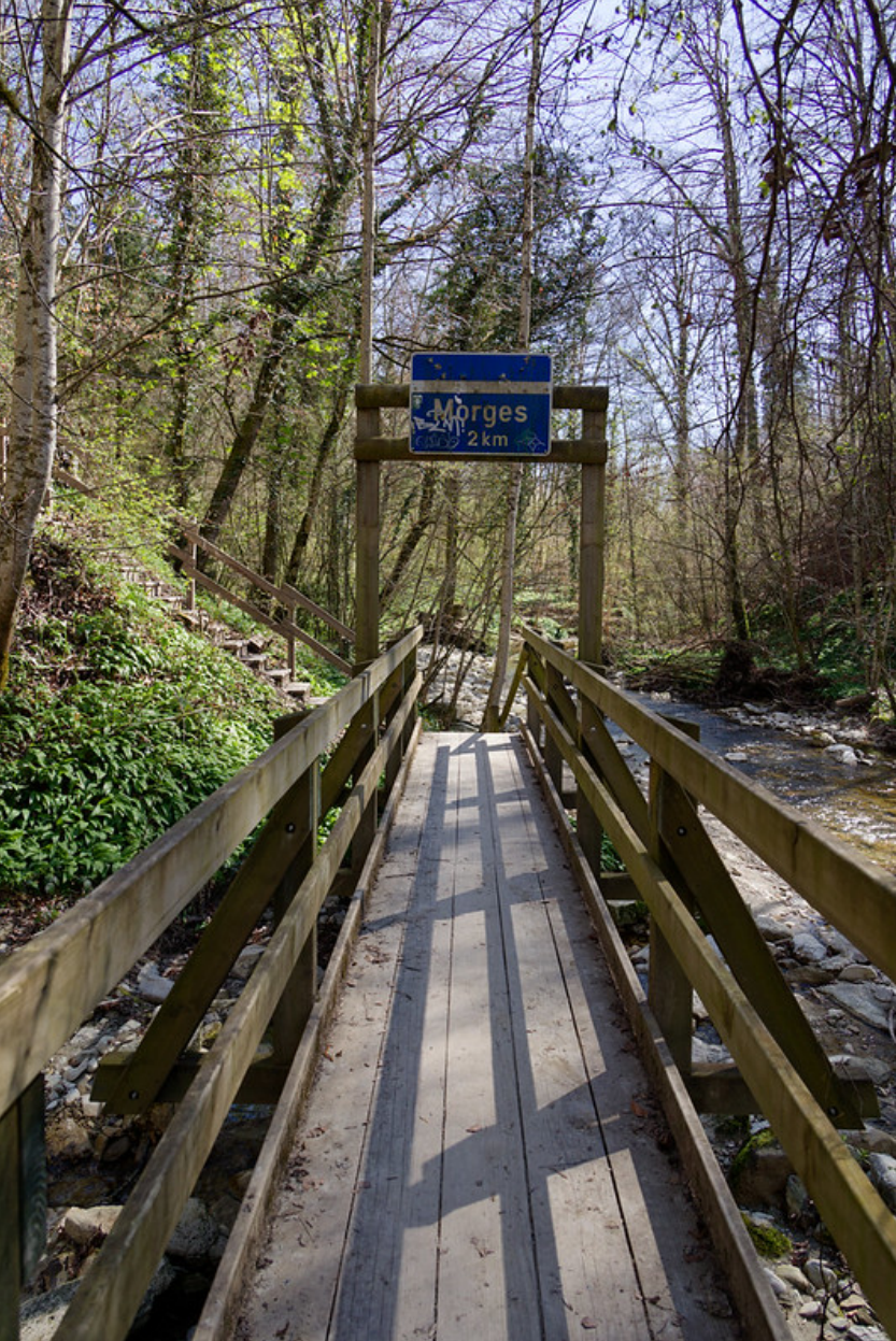
La fin s'approche...