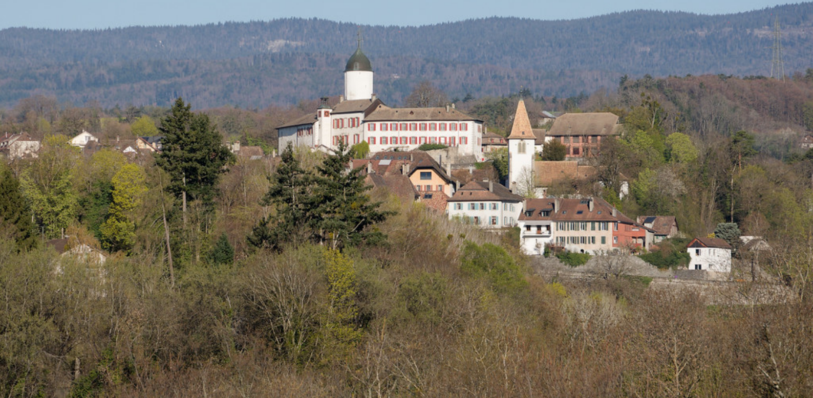
Le château d'Aubonne.

Simple » en février 2017, le terme « Albona » pourrait désigner une « source céleste » plutôt qu'une « source blanche ». L'adjectif « alb » y serait interprété comme évoquant le « monde supérieur » ou le « ciel ». Je n'ai toutefois pas pu me procurer l'intégralité de cet article, ce qui m'a laissé quelque peu sur ma faim.