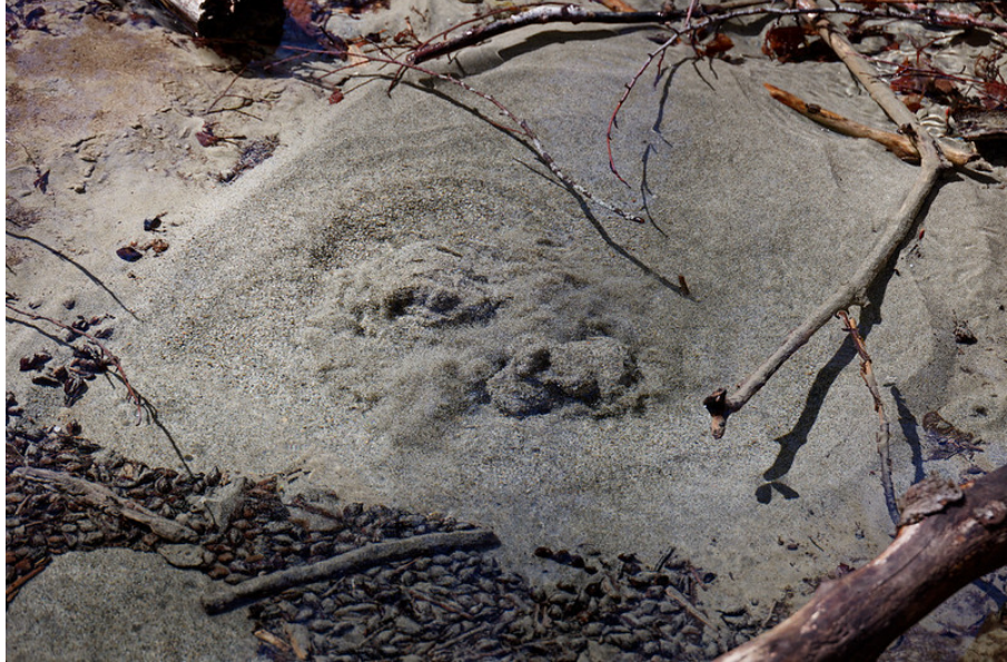
Une source vaclusienne du Boiron.

Ce qui m'a cependant le plus fasciné, c'est la présence d'une source vaclusienne, où le sable fin du fond semblait littéralement bouillir sous l'effet de la pression de l'eau remontant des profondeurs. Grâce à quelques rayons de soleil filtrant à travers le couvert végétal, la scène était à la fois saisissante et hypnotisante, animée par le mouvement perpétuel et silencieux des grains de sable en suspension.