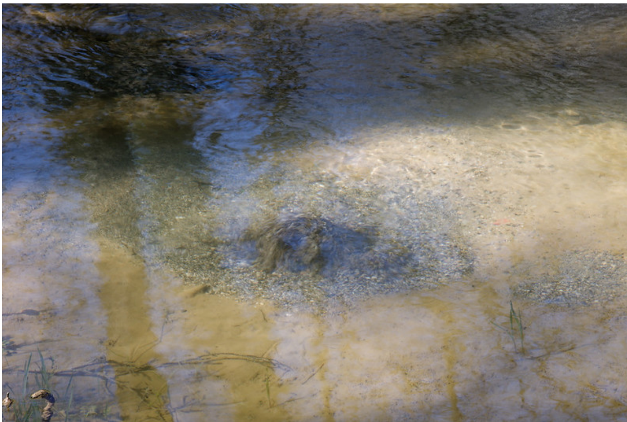
Une des sources vaclusiennes de l'Aubonne.

D'après les cartes topographiques, l'Aubonne reçoit également l'eau de plusieurs petits ruisseaux formés un peu plus haut dans la plaine : l'un prendrait sa source à l'est du village, près du lieu-dit du Châtelard, tandis qu'un autre émergerait au nord. Malgré mes recherches préalables, je n'ai malheureusement trouvé aucune information précise concernant l'accessibilité de ces sources secondaires : la première semble se situer dans une zone militaire vraisemblablement inaccessible au public toute l'année, tandis que la seconde paraît se trouver au milieu de prairies sans chemin pour y accéder. Plutôt que d'allonger inutilement mon parcours de plusieurs kilomètres pour une probabilité finalement très faible de pouvoir seulement atteindre ces points, j'ai préféré y renoncer et me contenter de la découverte, déjà amplement satisfaisante, que je venais de faire.