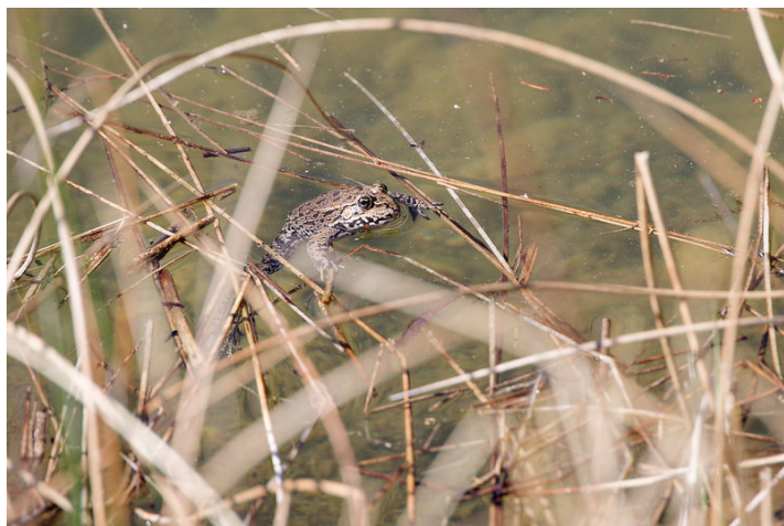
Un crapaud flottant dans l'étang de l'Arboretum.

Pour ma part, j'ai plutôt accéléré le rythme de marche afin de m'éloigner au plus vite du brouhaha ambiant et de retrouver la quiétude des sentiers forestiers. Peu après avoir franchi une nouvelle fois l'Aubonne par un pont de bois, le barrage de la centrale hydroélectrique du Plan Dessous s'est soudainement dévoilé à travers le feuillage clairsemé.