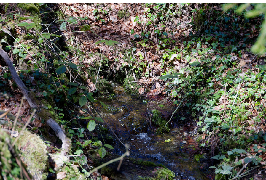
La source du Boiron indiquée sur la carte topographie.

Après avoir pleinement savouré cette exploration presque irréelle, j'ai rebroussé chemin pour regagner le petit chalet de bois. Là, un autre sentier, tout aussi bien marqué, menait cette fois vers le nord-est. J'ai supposé qu'il conduirait à la source principale indiquée sur la carte et j'ai décidé de le suivre.