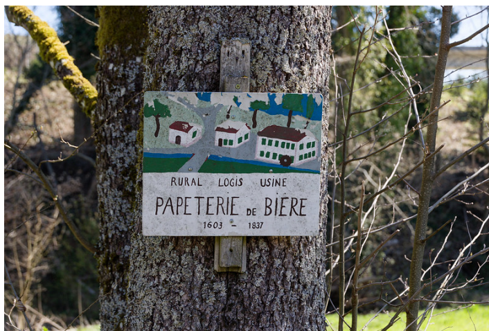
La dernière trace de la papeterie de Bière.

Une courte descente m'a alors permis de retrouver, l'espace d'un instant, la rive de l'Aubonne, le temps de changer de côté et de poursuivre vers le village de Bière.