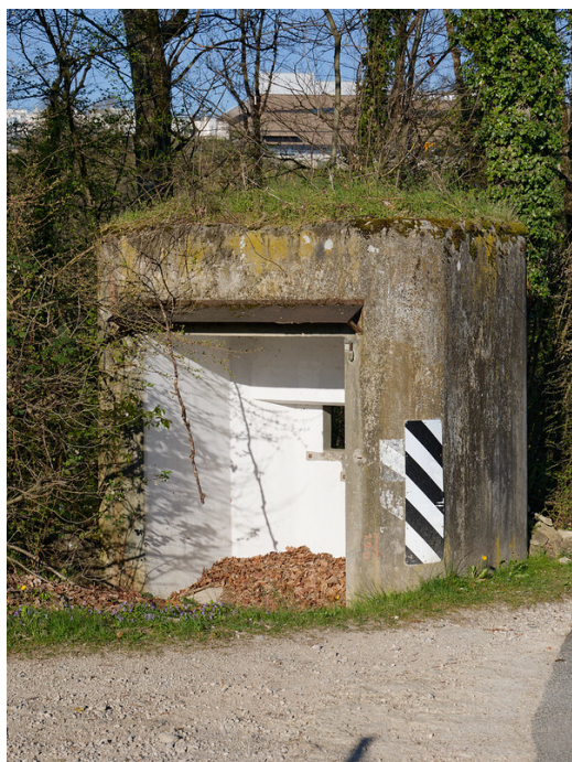
Ancien poste d'observation.

berge. Le bruit continu de l'eau courante a fini par masquer agréablement celui de l'autoroute voisine, instaurant une atmosphère bien plus sereine et immersive. Pendant ce temps, les rayons du soleil printanier traversaient les branches encore largement dénudées des arbres, dessinant de superbes jeux de lumière mouvants.