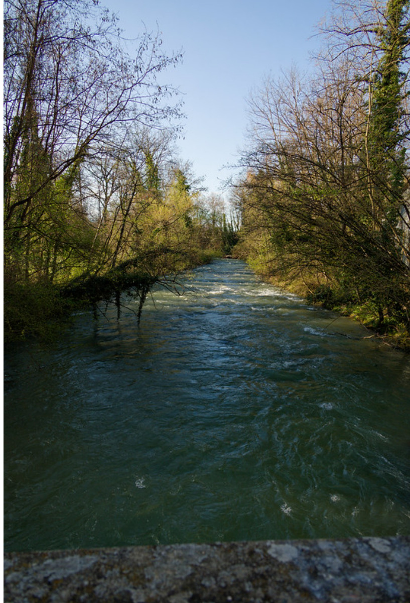
L'Aubonne en aval du pont.

C'est en partie pour ces raisons que cette randonnée s'apprécie tout particulièrement au printemps, lorsque la fonte des neiges alimente généreusement la rivière et lui assure un courant bien supérieur à la moyenne, offrant ainsi un spectacle bien plus vivant et dynamique (ce qui était justement le cas ce jour-là).