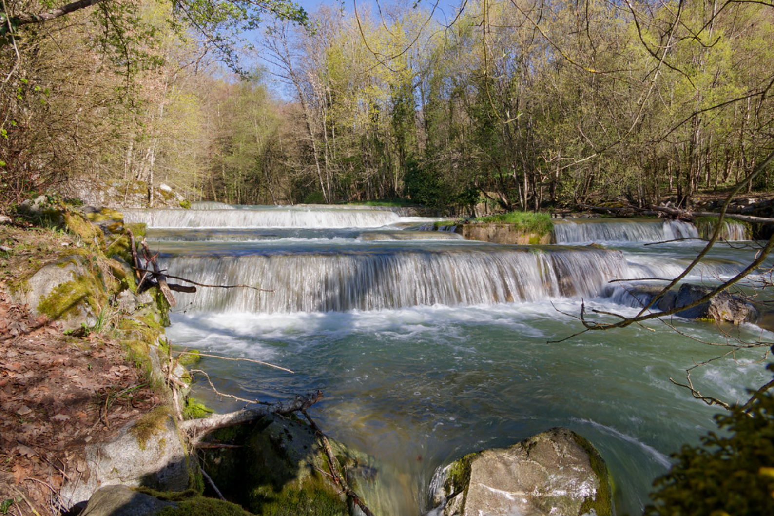
Mini-chutes de l'Aubonne.

directement au village d'Aubonne ; pour ma part, j'ai préféré poursuivre tout droit en direction de Bière, fidèle à mon idée initiale de remonter la rivière.