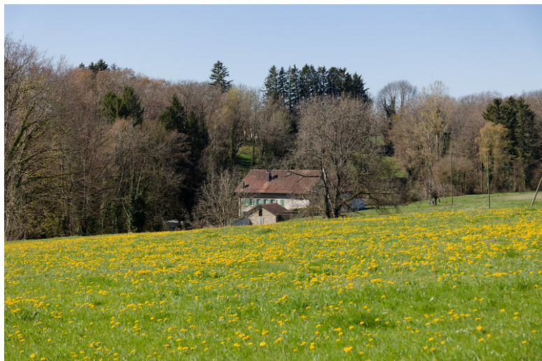
Moulin d'en Bas.

Quelques pas plus loin, aux alentours de P. 655, j'ai remarqué un panneau fixé sur un arbre, illustrant l'ancienne papeterie qui était en activité entre 1603 et 1837. Cette usine produisait autrefois de la pâte à papier à partir de vieux chiffons broyés et utilisait l'énergie hydraulique fournie par la rivière. Elle se situait à proximité immédiate de l'actuelle STEP et non à l'emplacement nommé « La Papeterie », comme on pourrait le croire en consultant les cartes topographiques modernes. De cet ancien site industriel, il ne subsiste malheureusement que quelques pierres éparées, souvent envahies par la végétation.