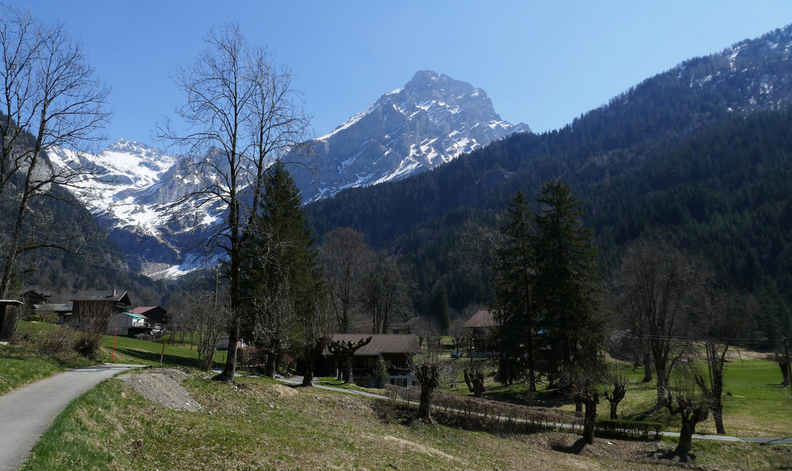
Superbe point de vue sur le Grand Muveran en arrivant aux Plans-sur-Bex .

Quelques 400 mètres plus loin continuer sur le sentier des gorges . Une courte descente et on se retrouve à nouveau au bord de l' Avançon de Nant .