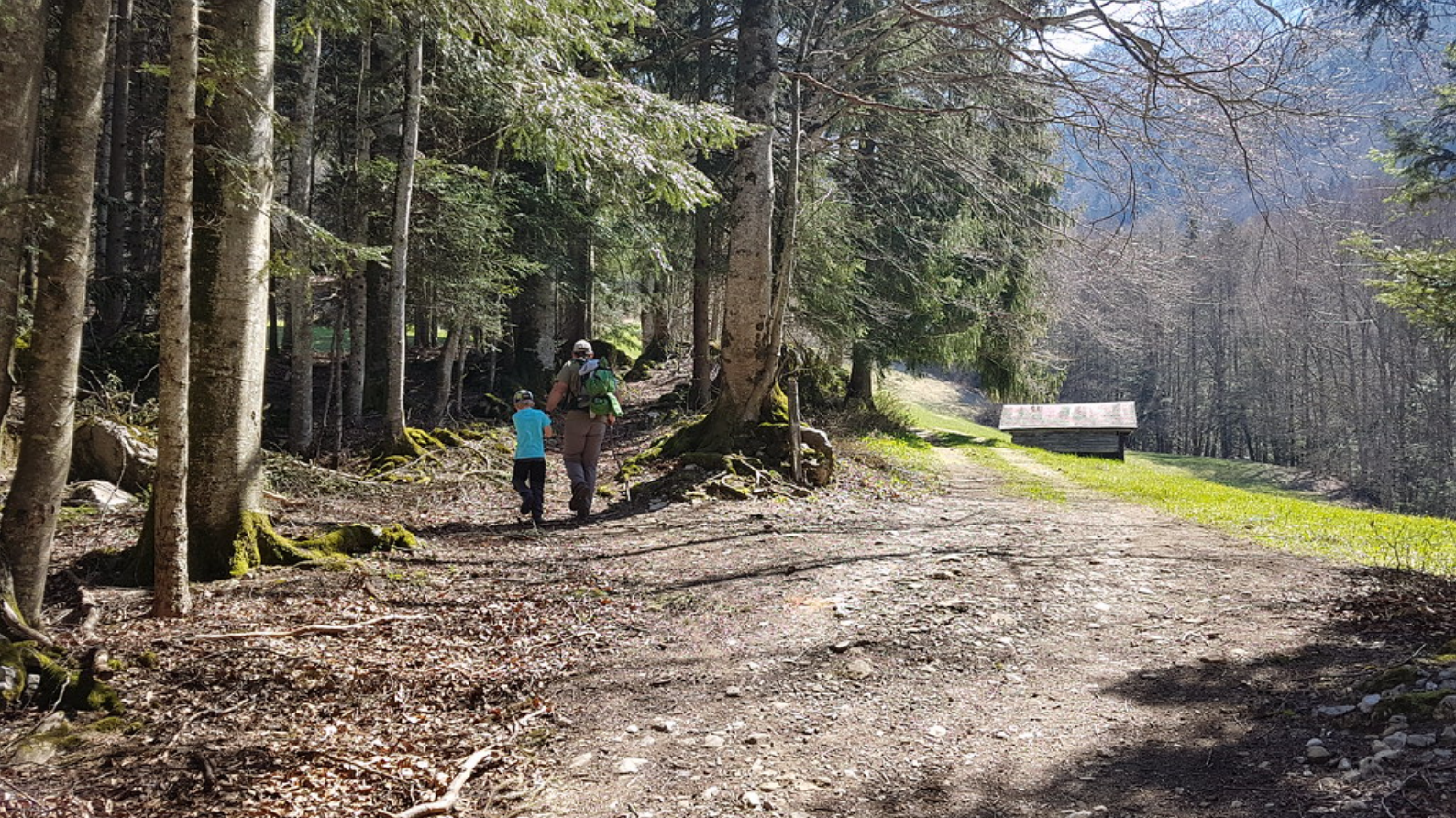
Dans la montée entre Frenières-sur-Bex et les Plans-sur-Bex .

redresse encore un plus et quelques longues marches en bois aident à franchir la partie la plus raide.