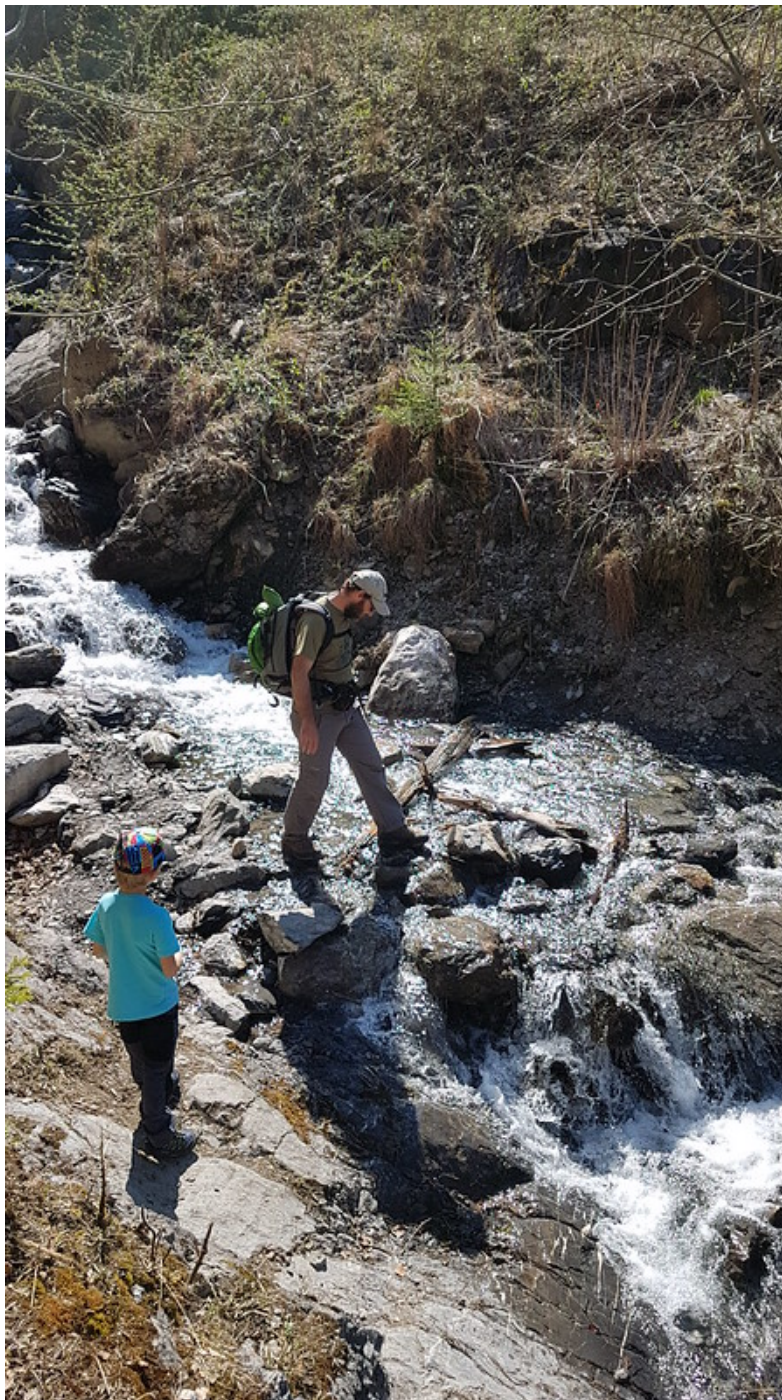
La traversée du Torrent Genin .