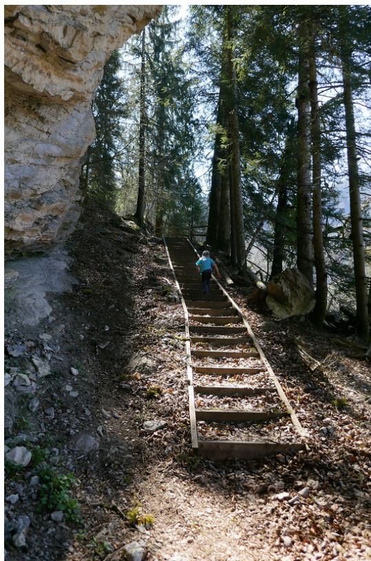
Les marches dans la partie la plus raide de la montée.

Suivre les panneaux en direction de « Frenières par les gorges ». Le parcours est légèrement différent par rapport à celui indiqué sur les cartes topographiques. L'avantage c'est que le nouveau parcours passe plus en forêt et moins le long de la route principale où les voitures roulent souvent vite.