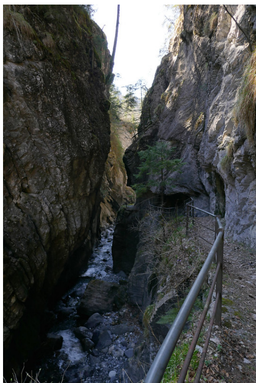
Dans les gorges.

Quelques 400 mètres plus loin continuer sur le sentier des gorges . Une courte descente et on se retrouve à nouveau au bord de l' Avançon de Nant .