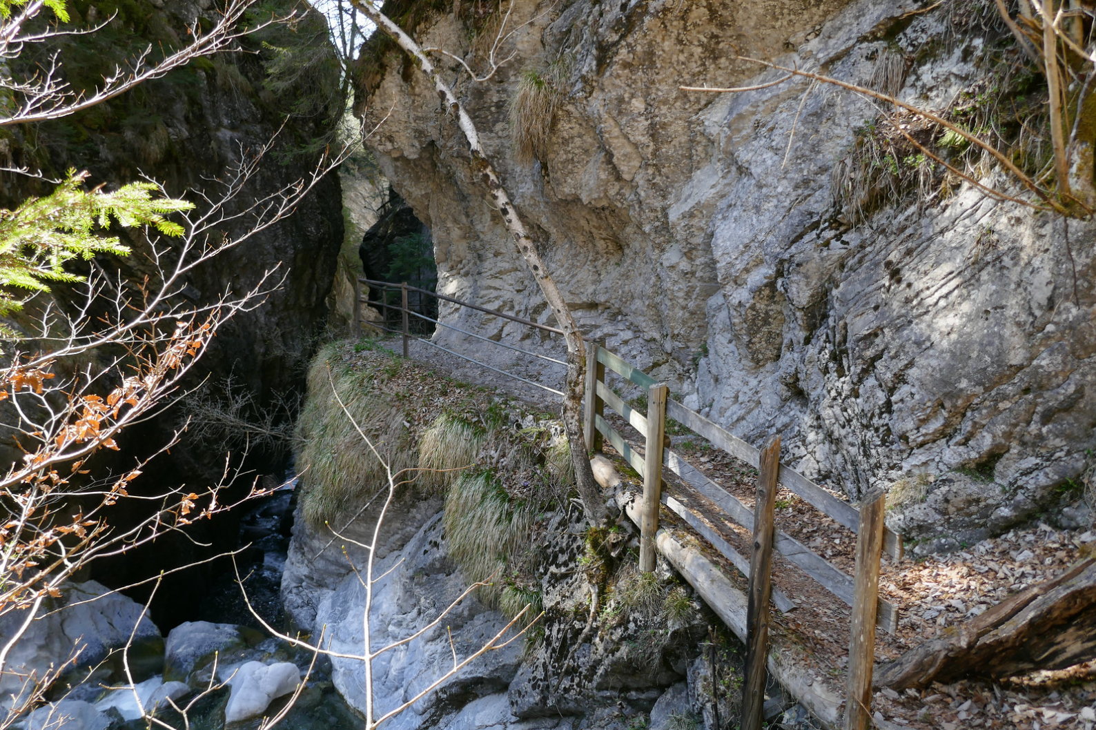
Le Gorges de l'Avançons de Nant sont jolies mais la visite est très courtes.

pont. Pendant la courte ascension on ne peut pas s'empêcher de regarder en face, à plusieurs reprises, le Torrent du Genin et ses impressionnantes chutes d'eau se jeter dans l' Avançon de Nant .