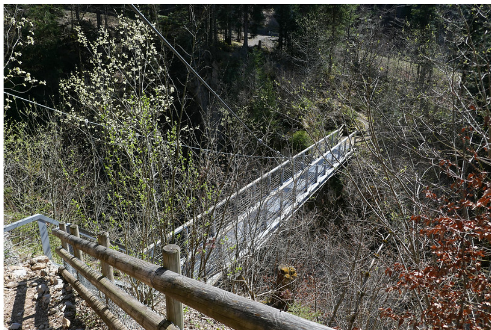
La passerelle qui donne accès aux gorges.