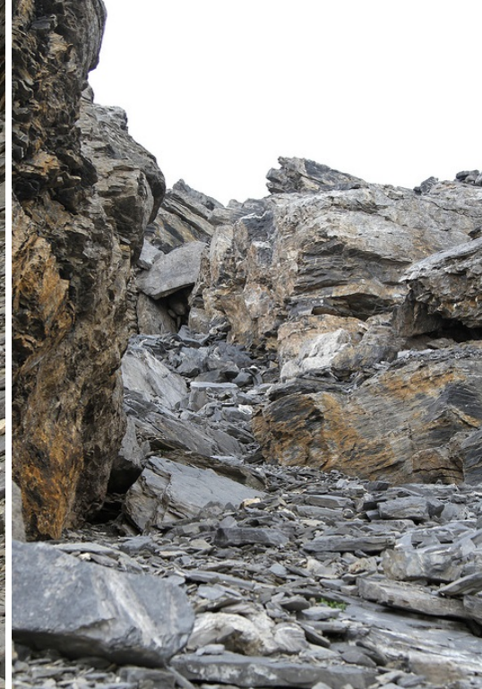
Traversée sur un pierrier instable (à gauche) et couloir raide (à droite).

variante d'ascension, en particulier à cause de cette traversée exposée ainsi et du couloir qui s'ensuit. En effet, la cotation de voie normale ne dépasse pas le T4 !