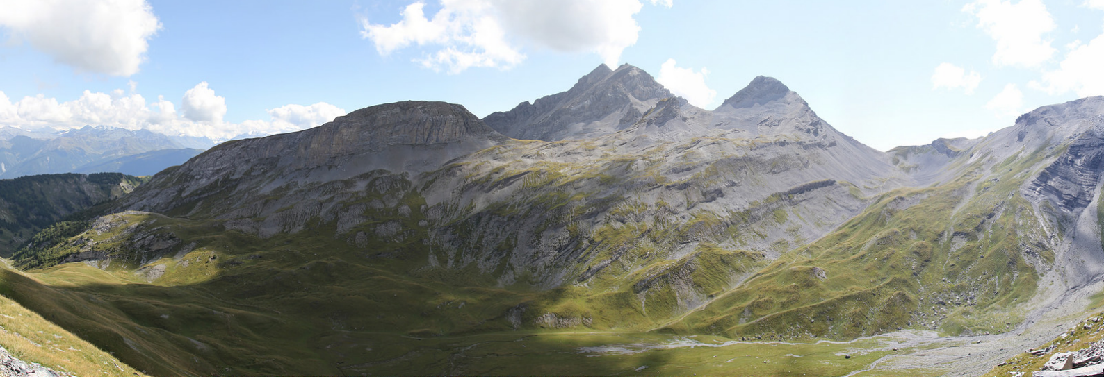
Vue sur le Grand Chavalard depuis le sommet de la Dent Favre.

étroite en utilisant les mains. Bien que le terrain soit un peu instable (glissouillant), il n'y a pas de difficultés majeures. Le couloir débouche sur des magnifiques dalles qui forment des gradins.