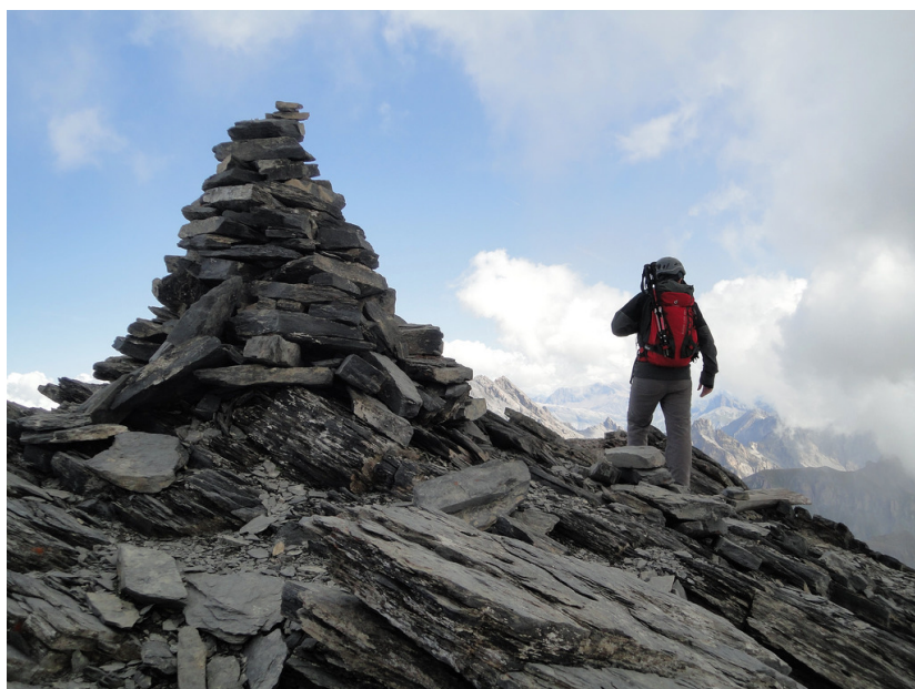
Le cairn au sommet principal.

Une centaine de mètres plus loin, on arrive au bord d'une falaise marquée d'un cairn qui offre une vue vertigineuse sur la combe d'Euloi. Il faut ensuite grimper le couloir sur la droite, particulièrement raide et jonché de caillasse très instable. Le port du casque est fort recommandé, surtout en groupe, car il est presque impossible d'éviter de provoquer des chutes de pierres !