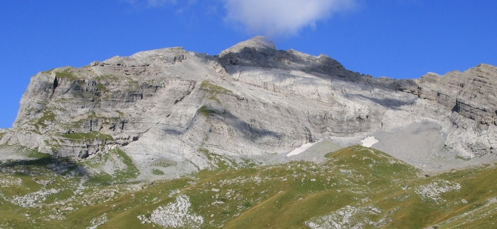
Le sommet de la Dent Favre vu depuis le Pré de Bougnone.

s'arrêtent au centre du village. Dans ce cas, suivre les panneaux du tourisme pédestre pour atteindre le départ du télésiège (environ 10 minutes de marche).