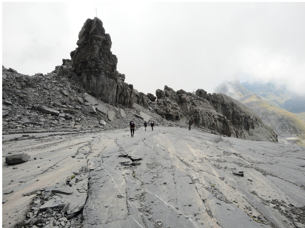
Ascension sur les dalles à hauteur de la saillie de roche avec la croix.

Pour diversifier notre randonnée, nous avons choisi de progresser directement sur les dalles jusqu'au point culminant. Cette option ne doit être envisagée que si la roche est sèche, sans névés ni plaques de glace. Il faut être à l'aise sur ce type de terrain, l'inclinaison des dalles ne permettant aucune erreur ni chute.