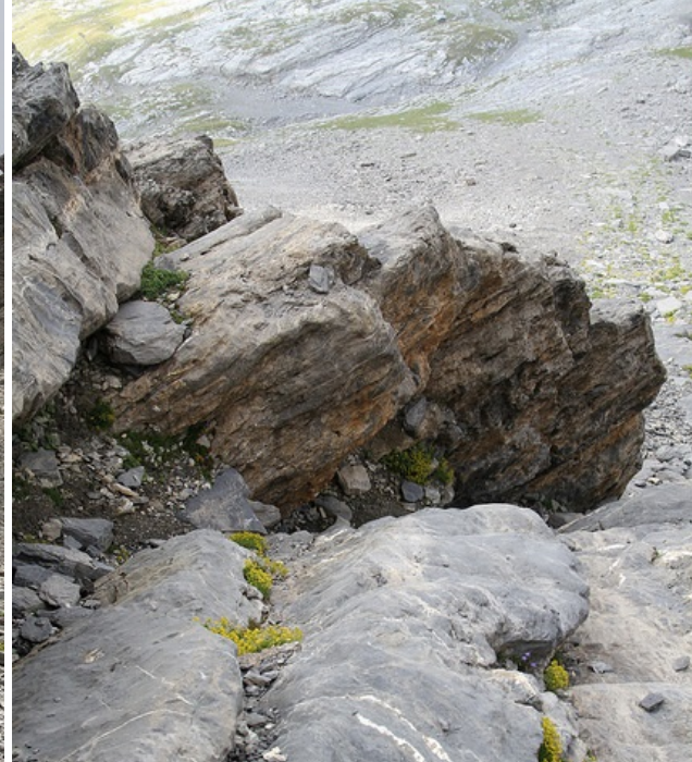
Itinéraire approximatif pour franchir la barre rocheuse vers 2620 m (photo de gauche). À droite, la cheminée juste au-dessus.

gazonnées jusqu'à atteindre environ 2500 mètres d'altitude, puis repérer une sente qui se fraye un chemin à travers la rocaïlle sur la droite, en direction des installations de déclenchement d'avalanche. Initialement, le sentier est peu visible, mais il devient plus marqué en prenant de l'altitude.