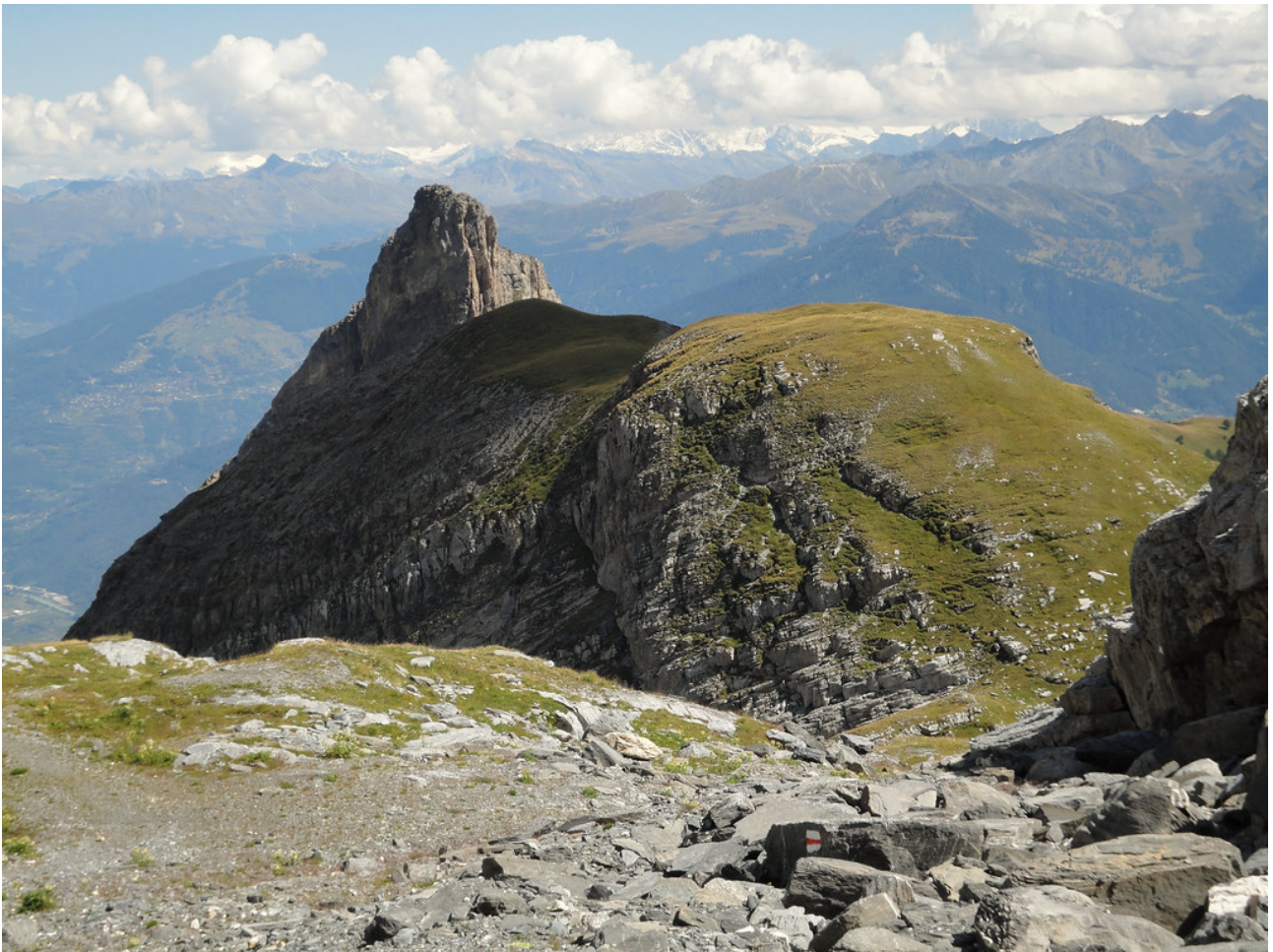
Le Six Aramille, qu'on contourne par la droite (sentier).

Retourner au sommet principal puis amorcer la descente en direction est-sud-est le long de l'arête, en empruntant une sente relativement bien marquée et ponctuée de petits cairns. Malgré un parcours sinueux sur un terrain parsemé de pierres instables, l'itinéraire demeure facile à suivre et est, dans l'ensemble, plaisant.