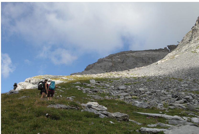
Vers 2450 mètres d'altitude, on quitte le sentier pour remonter les pentes herbeuses.

Une fois à Jorasse, prendre le sentier pédestre en direction du Pré de Bougnone. Une route d'alpage nous a guidés d'abord à travers la combe, puis le monte vers le sud-sud-ouest, en suivant les poteaux du télésiège de la Tsantonnaire.