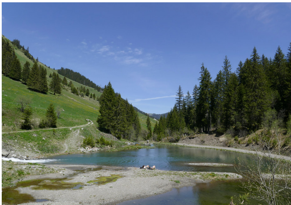
L'étang de Sassey.

Passer la Cantine de They et continuer le long du cours d'eau. Le chemin devient plus étroit, la rivière plus sauvage et il y avait moins