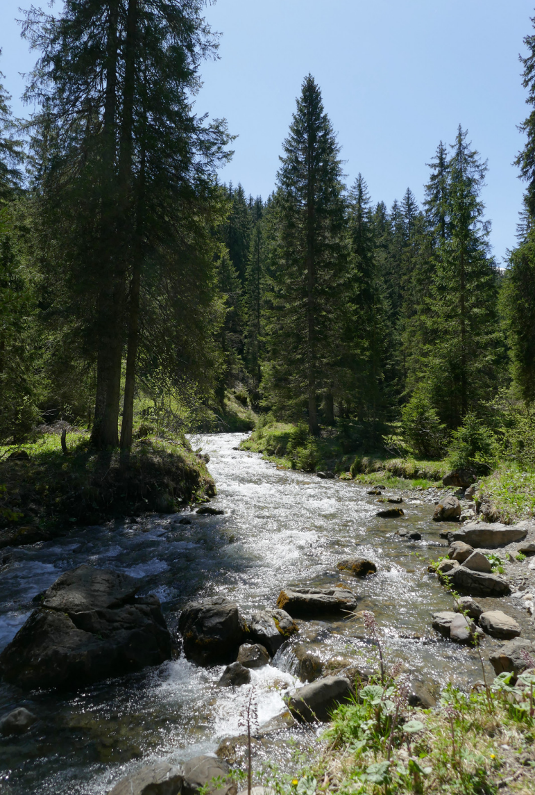
La Vièze de Morgins.

de bipèdes qui se promenaient. On rejoint rapidement l'étang de Sassey créé artificiellement il y a une quarantaine d'années lors de l'extraction de matériel. La couleur de l'eau est magnifique et plusieurs petits groupes se reposaient dans ce coin très paisible.