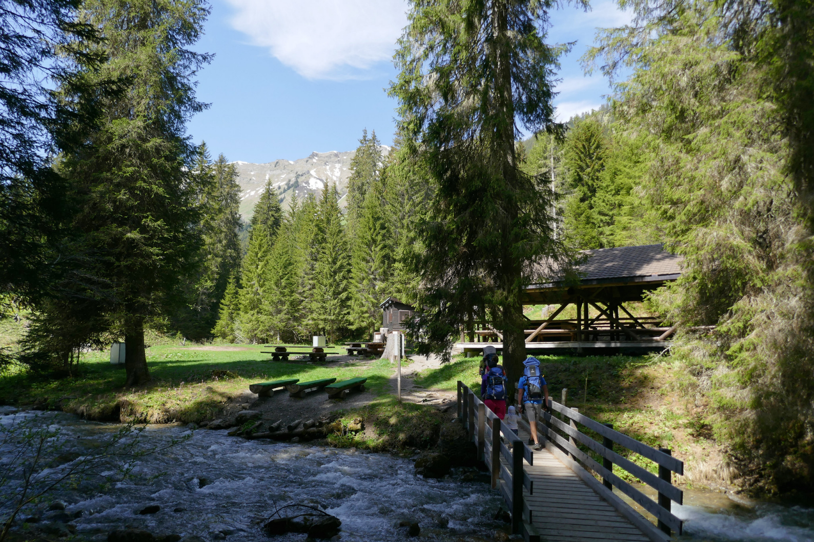
À l'entrée de la première aire à pique-nique.