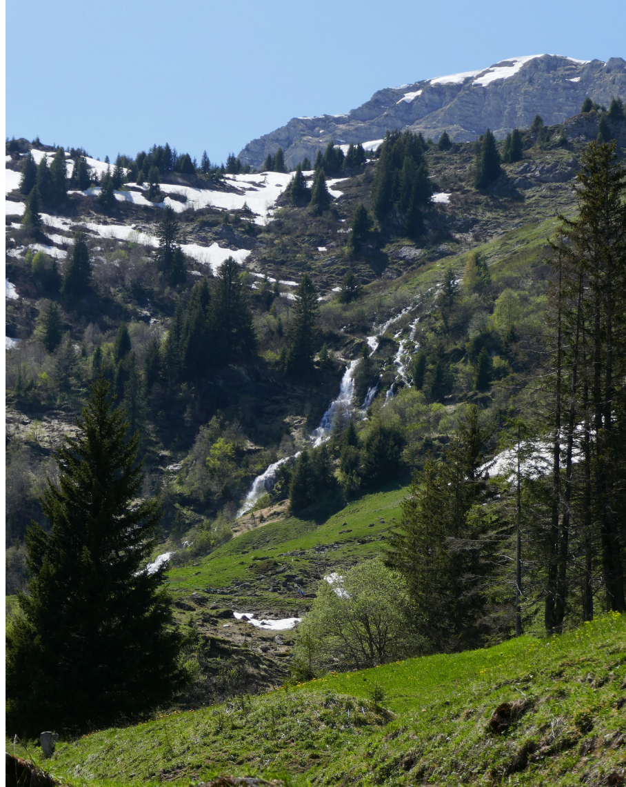
Les cascades des Fontaines Blanches.

Passer devant la baraque et descendre jusqu'à gagner le premier pont.