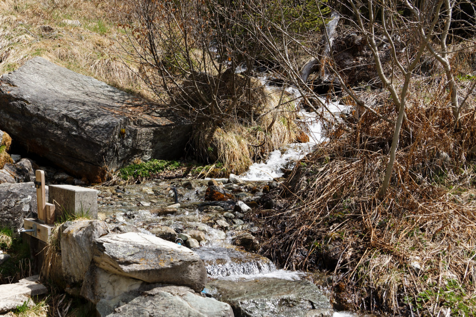
La prise d'eau du bisse de Tsa Crêta .

L'endroit était particulièrement paisible. Nous avons profité un instant du calme avant de continuer notre route.