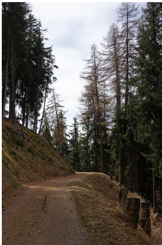
Dans la Forêt de Suen .

Nous avons ensuite amorcé la descente en direction de Suen (panneaux) en longeant le torrent qui fait de belles cascades.