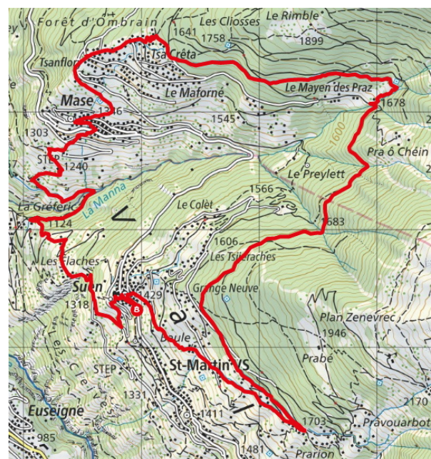
Carte nationale.

Suen est desservi par des cars postaux au départ de Sion . Il y a des liaisons directes et d'autres avec changement à Fon .