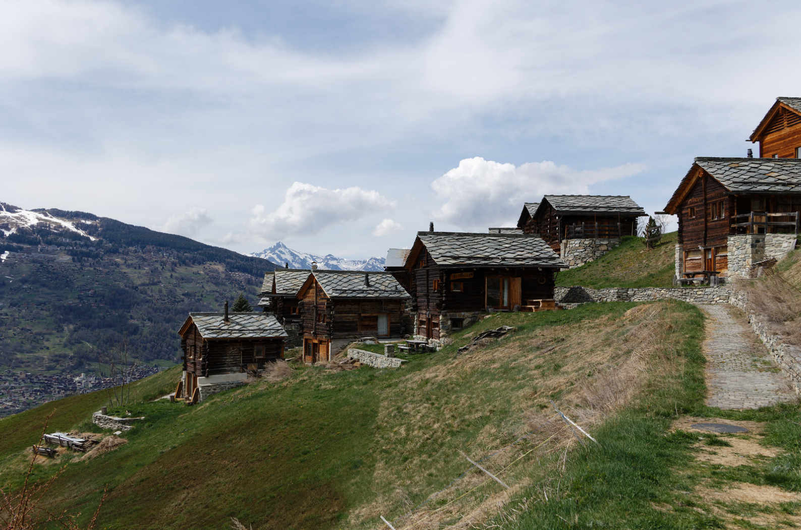
Le hameau de Baule .

Entre les chalets de Vauty et le hameau de Baule , le bisse dévale dans les pentes herbeuses en direction de Saint Martin .