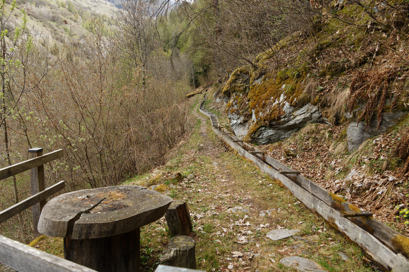
Un long bazot du bisse d'Ossona .

construction ancestrale et le moins que l'on puisse dire c'est que la remise en état est vraiment superbe.