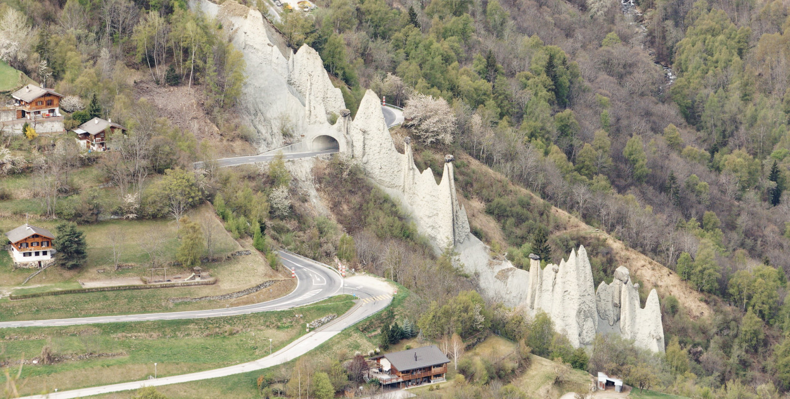
Vue sur les pyramides d'Euseigne.

tany. Descendre à l'arrêt « Suen, Centre ». Veuillez consulter l'horaire en ligne des CFF pour trouver la meilleure correspondance.