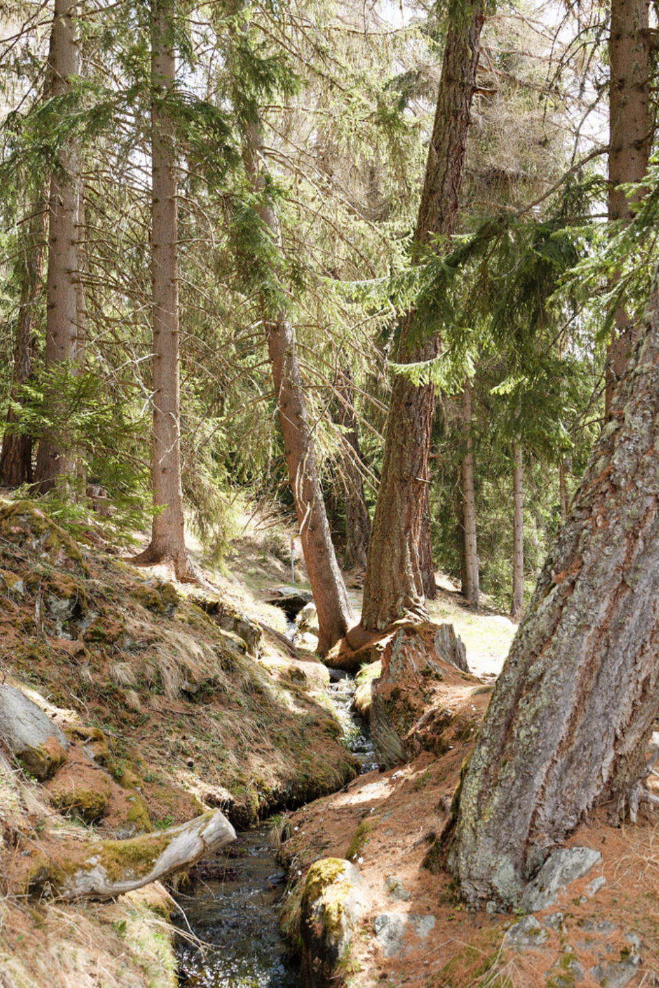
Le long du bisse de Tsa Crêta .