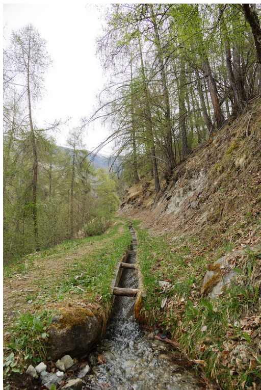
Le long du bisse d'Ossona .

Depuis le parking, suivre la route principale qui pénètre dans le village sur environ 200 mètres jusqu'à gagner P. 1429 avec des panneaux jaunes du tourisme pédestre. Depuis l'arrêt du bus, marcher une cinquantaine de mètres en direction sud-est pour gagner les panneaux susmentionnés.