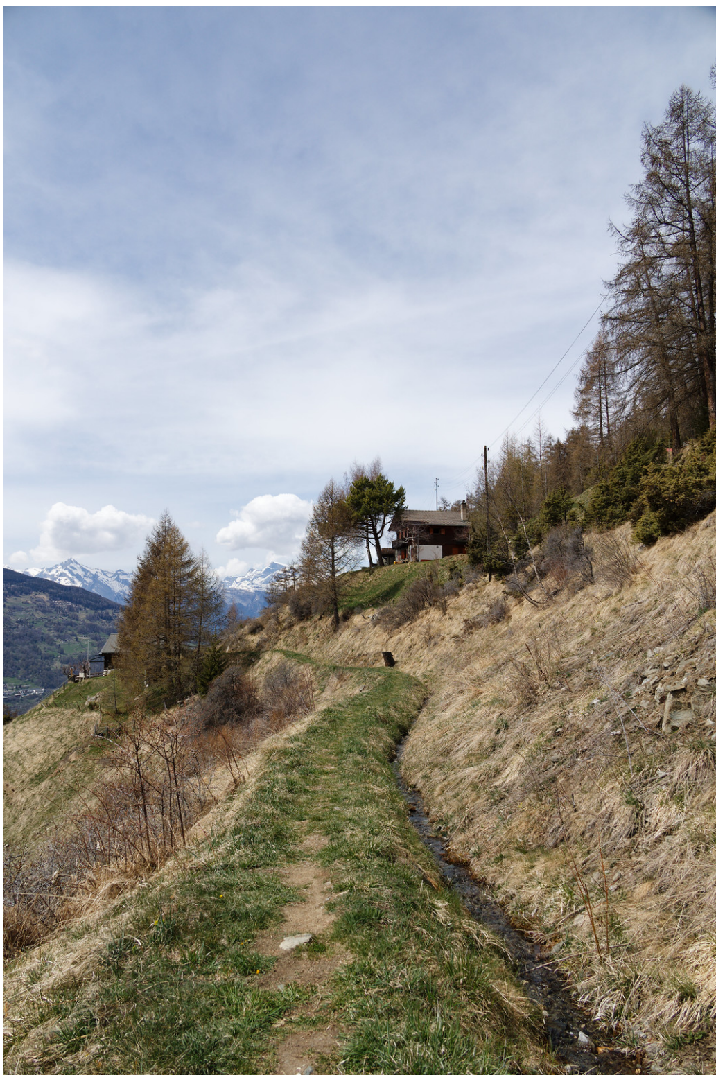
Le long du bisse de Saint Martin .

Après une centaine de mètres, nous avons retrouvé le Bisse de Saint Martin qui coule doucement en direction de Baule .