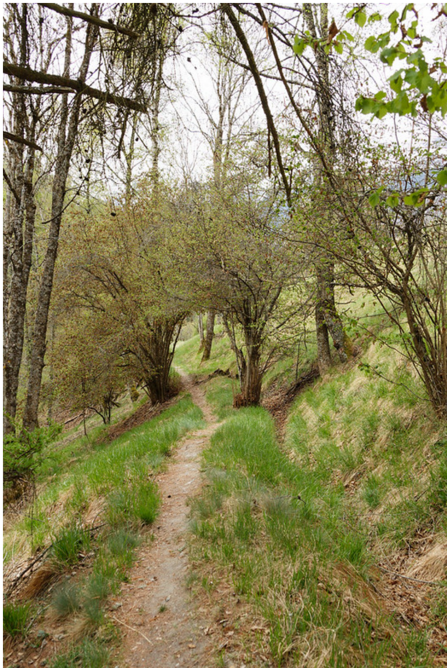
Du bisse de Sevanne il ne reste que quelques traces du canal creusé dans le sol.

Entre les hameaux de Tsanflory et de Tsa Crêta (du patois « champs en hauteur »), il y a beaucoup de chalets. La plupart sont des maisons de vacances, qui sont inhabitées en ce début de saison. J'ai hautement apprécié l'eau fraîche des nombreuses fontaines qui jalonnent ce tronçon, bien meilleure que celle de la gourde !