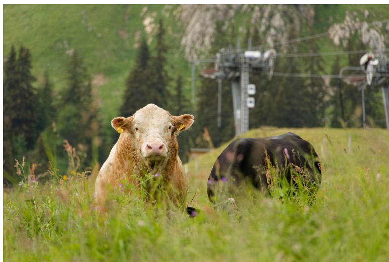
Un taureau dans l'alpage de Sonnaz.

Peu après avoir passé l'Hôtel des Fontaines (sur la droite de la route), on gagne un poteau indicateur (sur la gauche de la route). Poursuivre à droite en direction de Dorchaux. Une route asphaltée monte en serpentant dans les champs en fleur et quelques chalets jusqu'à une bifurcation de sentiers pédestres (P. 1515).