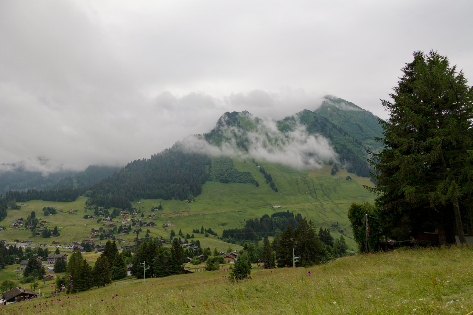
Vue boucheé sur le Pic Chaussy.