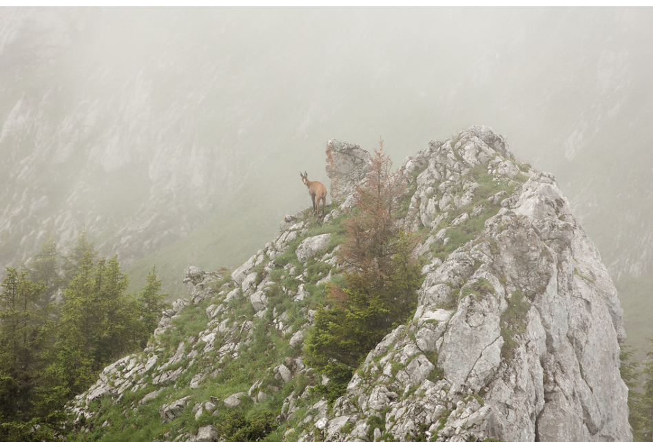
Sur l'arête de Dorchaux.