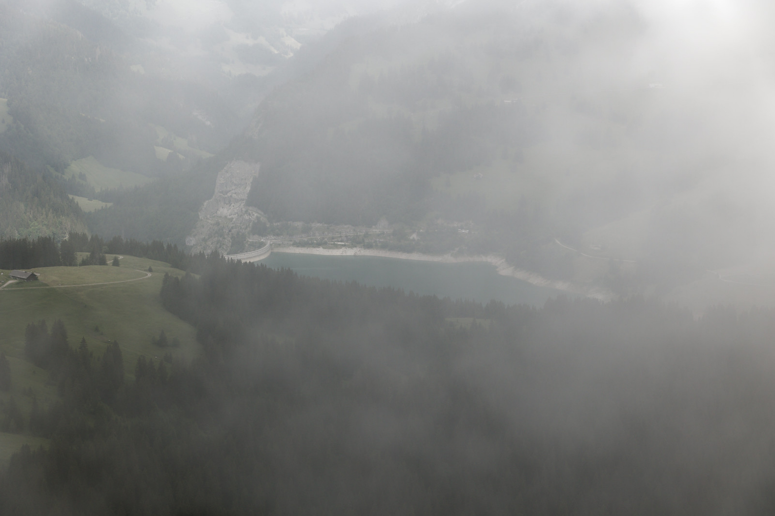
Vue boucheé sur le Pic Chaussy.

très engagée et comportait même des passages d'escalade (I-II). J'ai estimé les difficultés à (au moins) T5. Le sol était encore relativement humide et à cause du brouillard je pouvais à peine évaluer le terrain et la suite du parcours. Tout cela complexifiait davantage la progression. J'ai décrété que le jeu n'en valait pas la chandelle, j'ai rebroussé chemin sans aucun regret et j'ai regagné le collet.