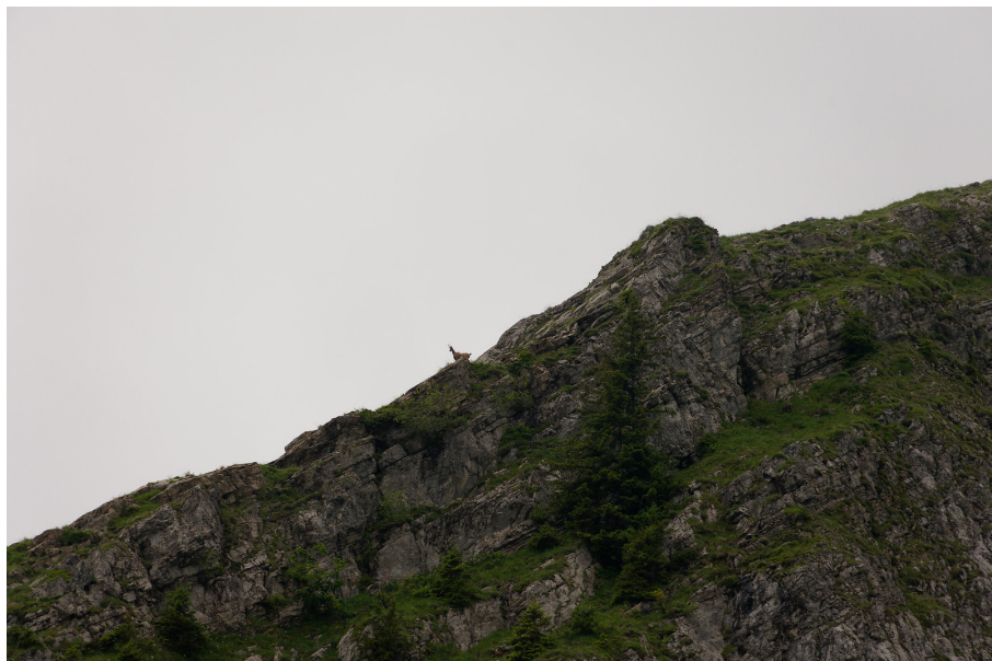
Un chamois sur l'arête sud-est du Petit Van.

Un panneau indiquait juste de « longer l'arête ». Un sentier bien marqué remonte selon l'instruction jusqu'au sommet (P. 2042), sans nom sur les cartes topographiques.