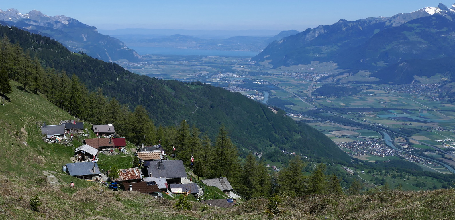
Les Planeys et la plaine du Rhône.

du tourisme pédestre. Partir à droite en direction des Mayeux . En quelques minutes on rejoint un croisement à côté du parking du haut du village.