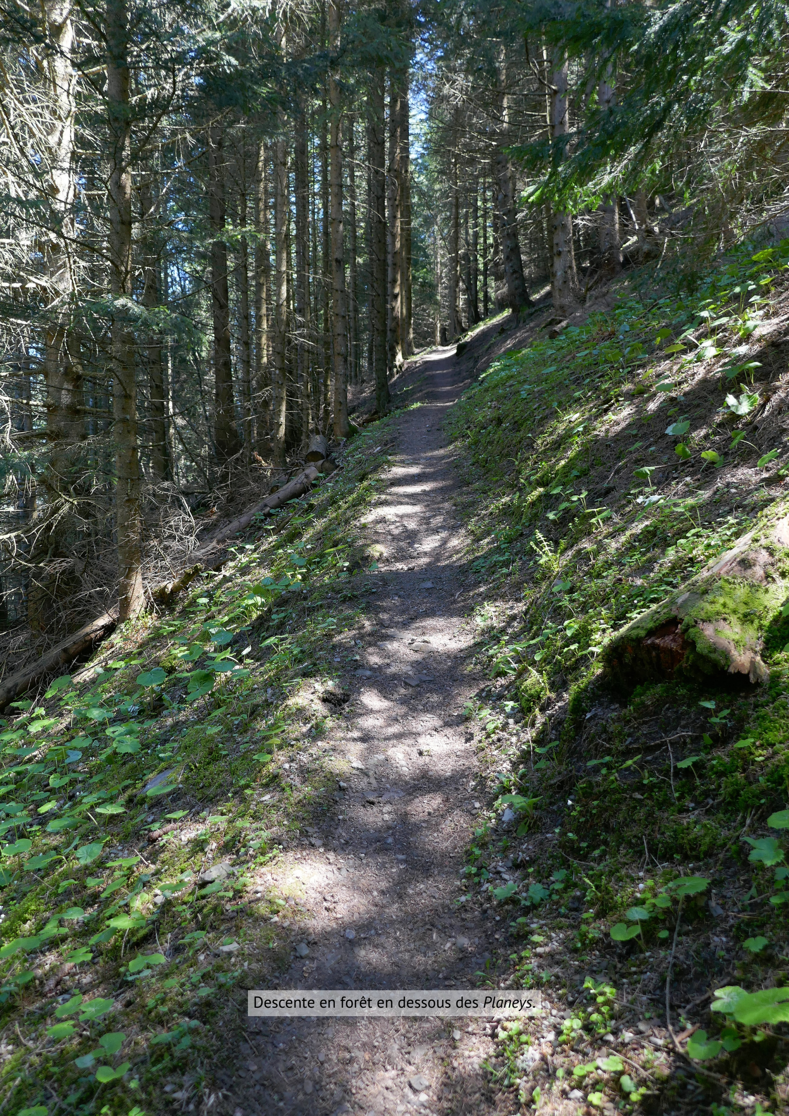
Descente en forêt en dessous des Planeys .